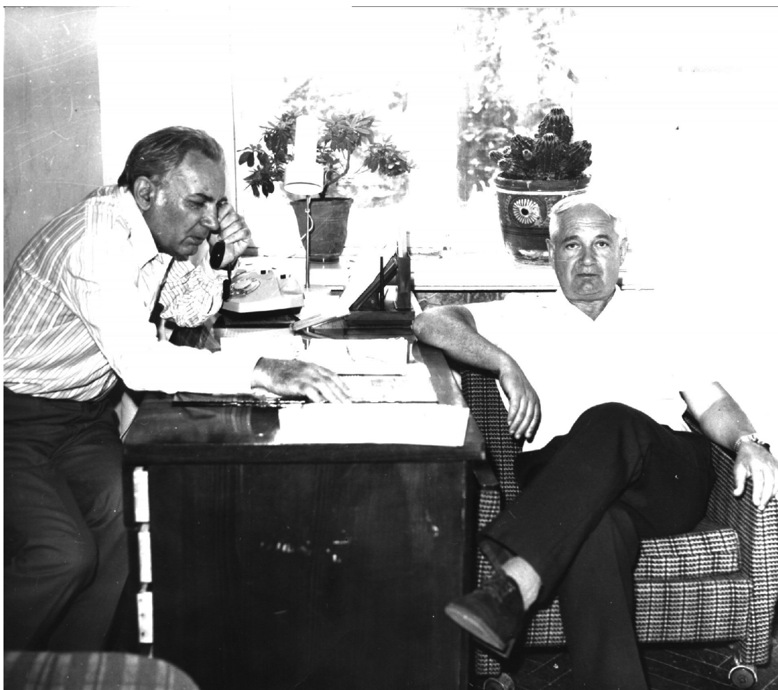
Академік НАН України Ю.Р. Шеляг-Сосонко з візитом у СНАУ