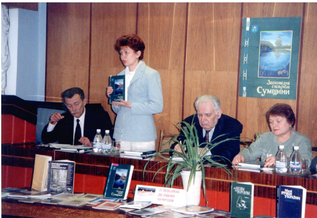
На презентації книги «Заповідні скарби Сумщини».