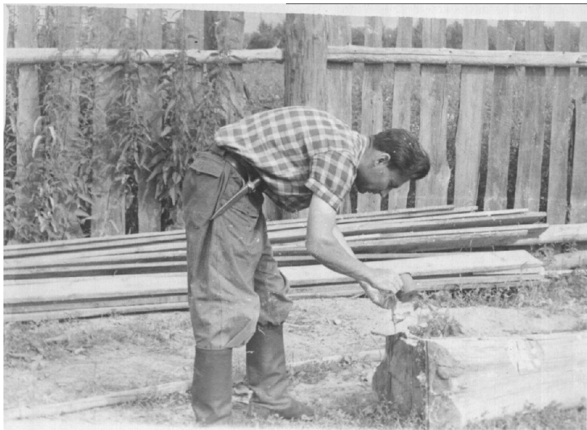
В експедиціях побут особливий (1961 р.)