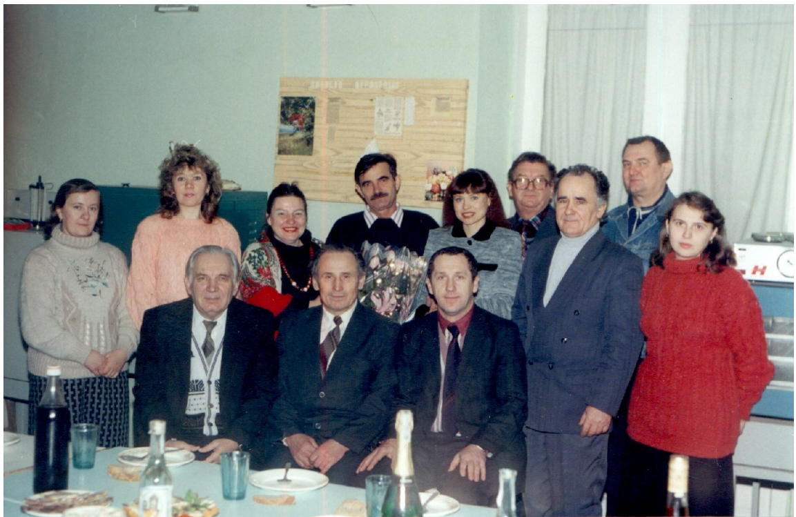
Разом працюємо, разом відзначаємо успіхи та досягнення