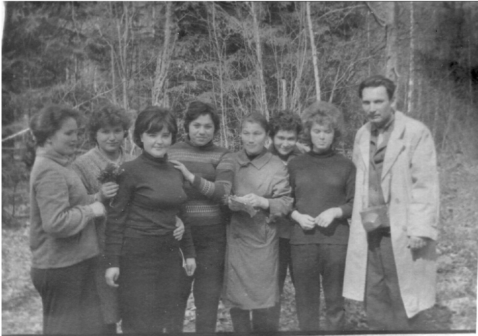
Полева практика з ботаніки (Тюмень, 1960 р.)