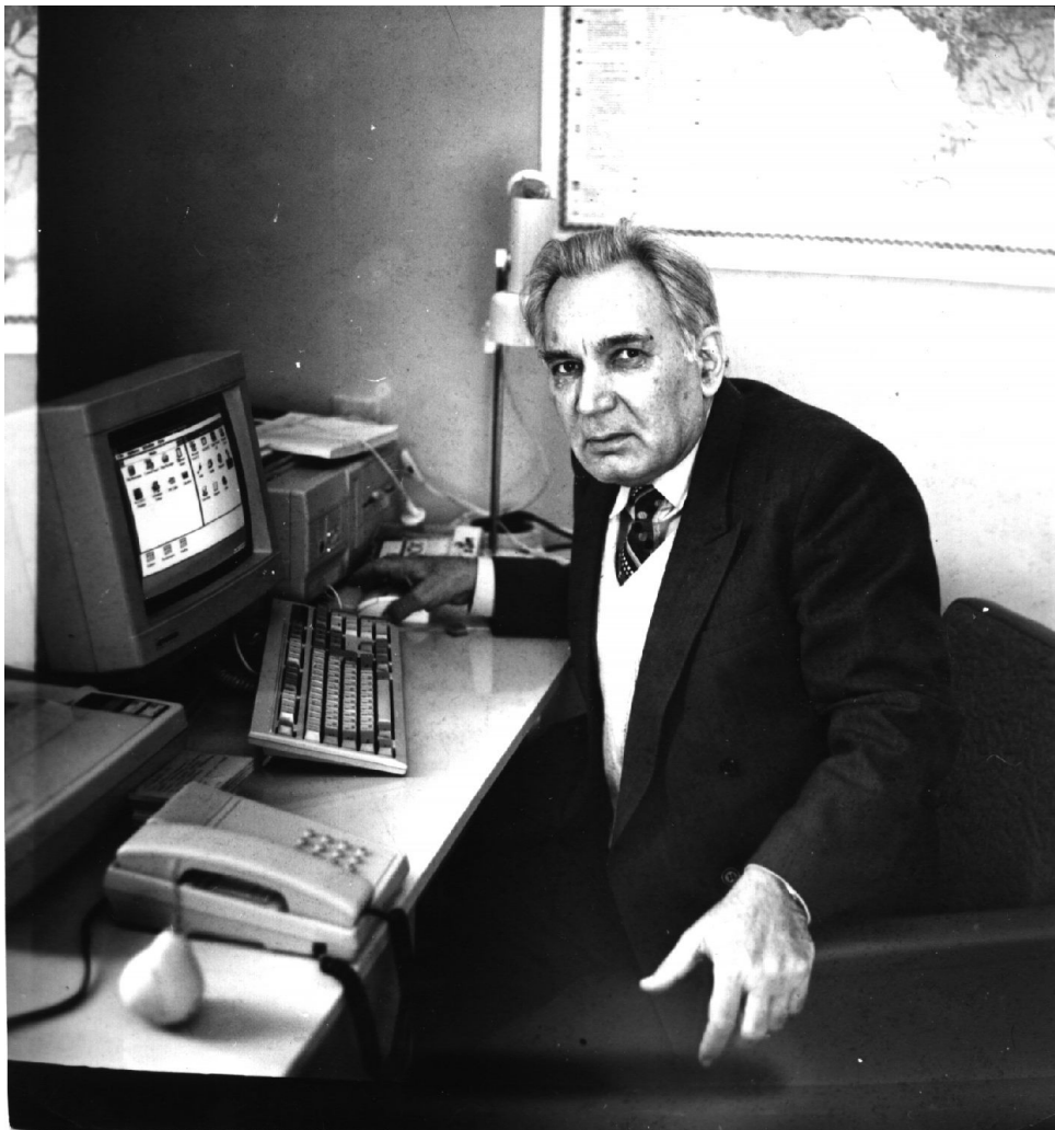
Опановується перша комп'ютерна техніка