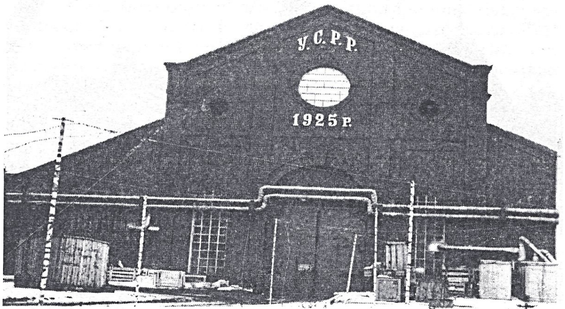
Західний фасад цеху № 5 Сумського машинобудівного заводу ім. М.В. Фрунзе

найбільших ушкоджень внаслідок пожежі 1925 року. До речі, приміщення відбудованого механічного цеху (нині – механозбиральний цех №5 Сумського машинобудівного науково – виробничого об'єднання ім. М.Фрунзе), на думку сумського історика М. Манька, є цінним зразком промислової архітектури і потребує охорони як історична пам'ятка[10, 118]. Наприкінці 1920 – х рр. розпочалася масштабна технічна реконструкція підприємства: велося будівництво котельного цеху, заводських електростанції та лабораторії.