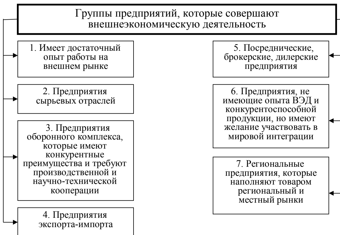
Рис. 1. Признаки предприятия, которое выходит на внешний рынок

Решение о расширении экономической деятельности предприятия с целью реализации отечественного товара иностранным потребителям и, соответственно, получения дополнительной прибыли должно подкрепляться выбором соответствующего внешнеэкономического рынка при имеющихся потенциальных возможностях. Применение алгоритма, представленного на рис. 1.2, позволит облегчить принятие такого решения для предприятия [8].