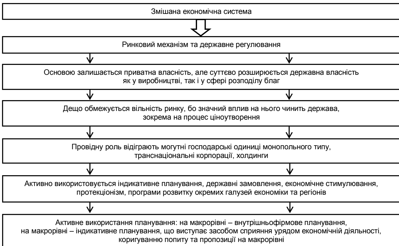
Рис. 4. Схематична модель змішаної економічної системи

* власні дослідження у відповідності до [4]