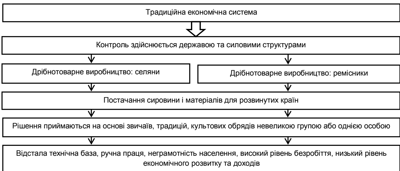
Рис. 1. Схематична модель традиційної економічної системи

Традиційною економічною системою є економіка, в якій практичне використання ресурсів визначається традиціями та звичаями, їй притаманні певні ознаки. На рис. 1. зображена схематична модель устрою традиційної економічної системи. В ній, як правило, переважає сільськогосподарське виробництво. Технічний прогрес обмежується наявними традиціями та звичаями. Велику роль відіграє іноземний капітал. Зазвичай країни традиційної економіки є постачальниками сировини і матеріалів для розвинутих країн і виступають ринками збуту готової продукції останніх, тобто є аграрно-сировинним додатком колишніх своїх метрополій.