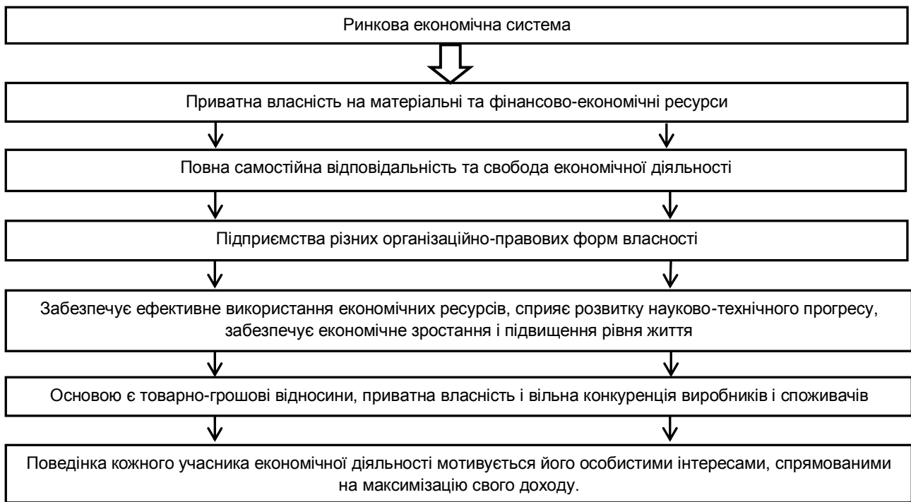
Рис. 3. Схематична модель ринкової економічної системи

* власні дослідження у відповідності до [4]