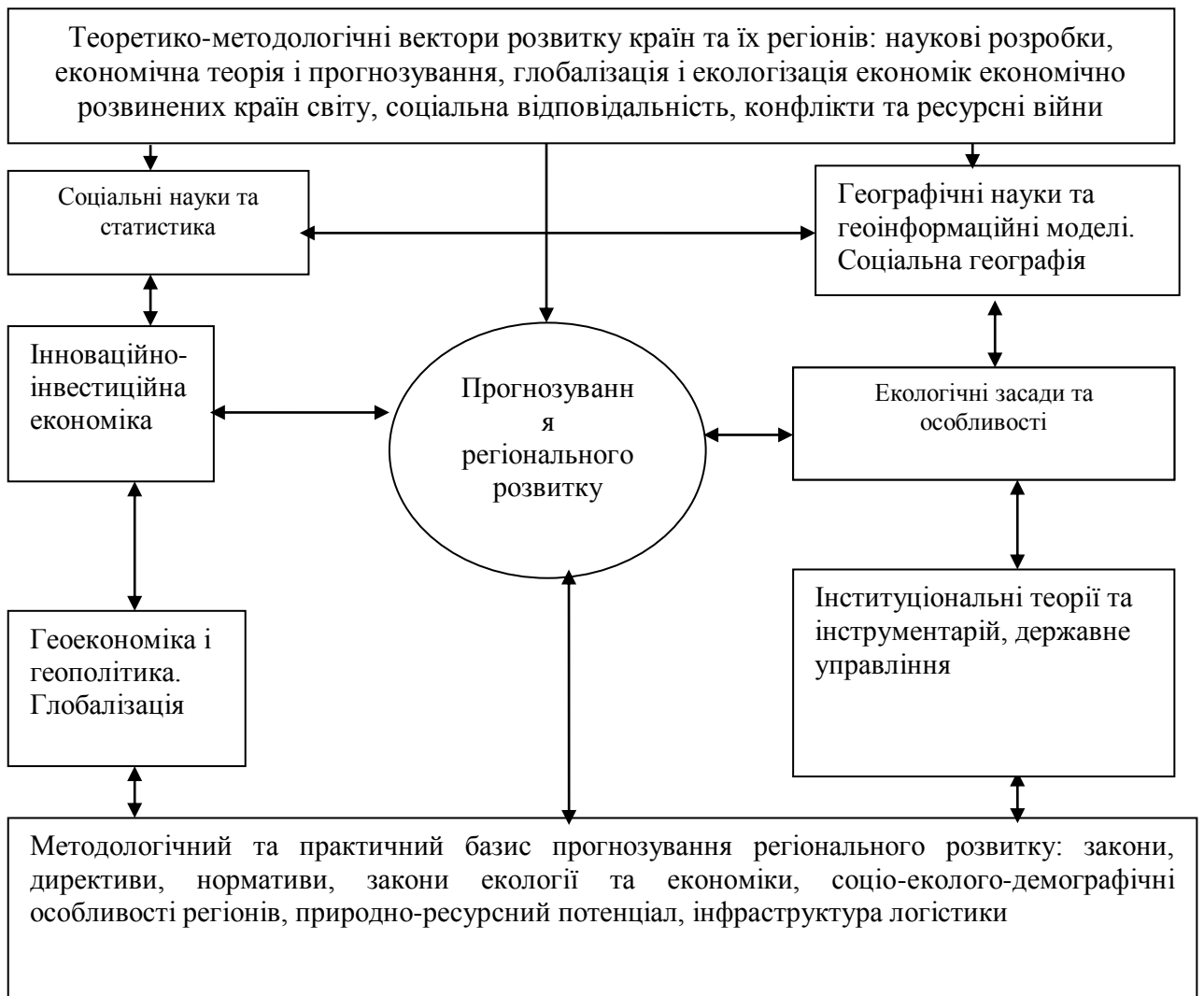
Рис. 1. 1.- Особливості вивчення і прогнозування регіонального розвитку економіки