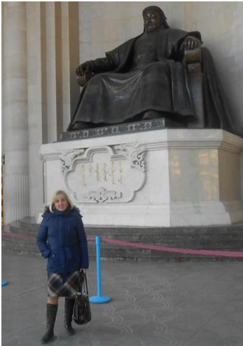
Монголія. Семінар з якості та безпеки продуктів тваринництва (2011 рік)