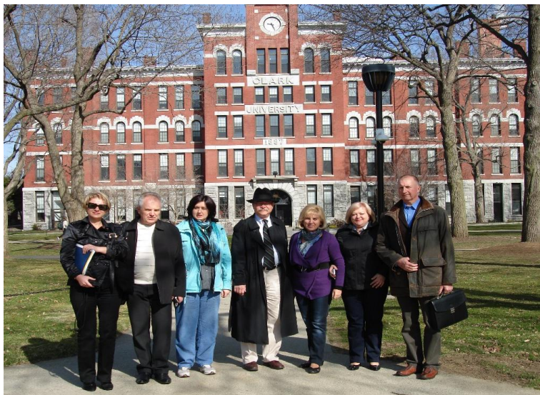
Університет Кларка США (2011 рік)