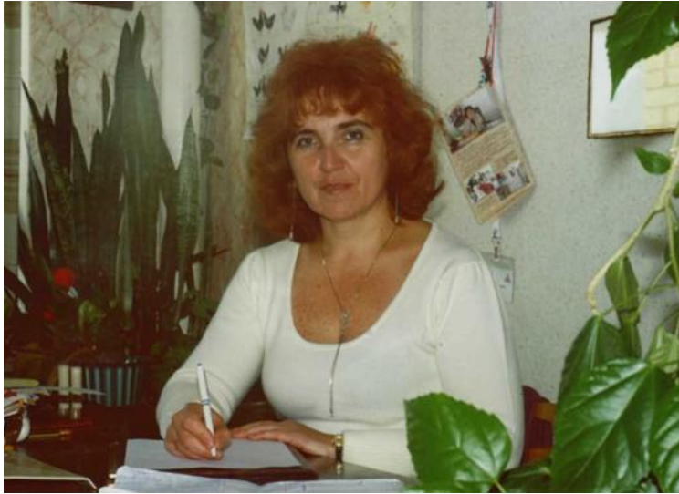
Комерційний директор Сумської державної біологічної фабрики (2001 рік)