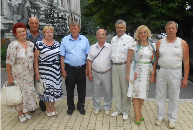
Зустріч з одногрупниками через 35 років (2013 рік)