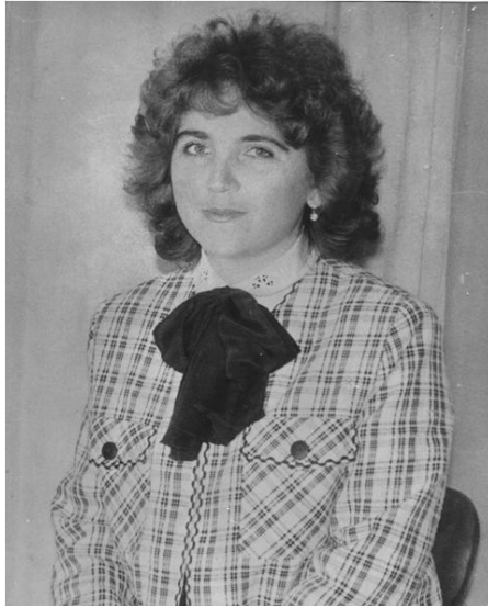
Початок трудової діяльності в СНАУ (1988 рік)