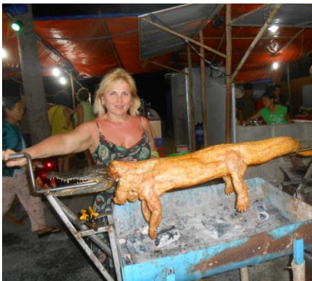
В'єтнам. Семінар з питань птахівництва (2013 рік)