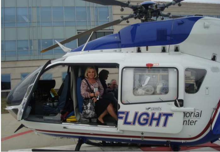
Сполучені Штати Америки. Віліт у район стихійного лиха (2011 рік)