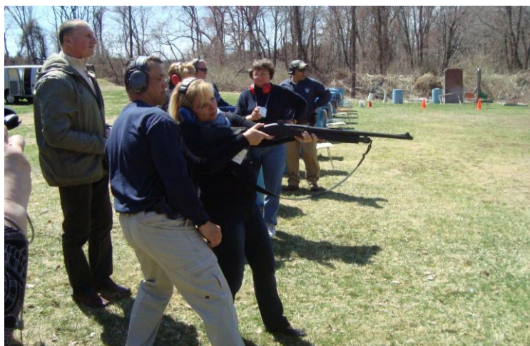
США. Здача іспиту зі стрільби (2011 рік)