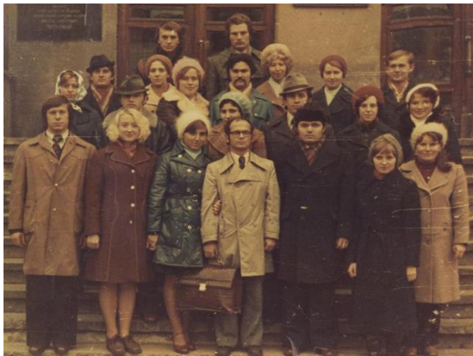
Прощай, Alma mater – ХЗВІ (1978 рік)