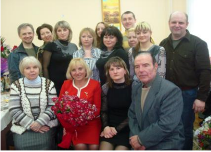
З улюбленою кафедрою (2006 рік)