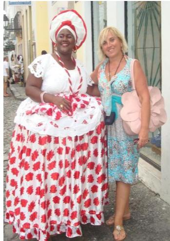
Бразилія. Всесвітній конгрес з птахівництва (2012 рік)