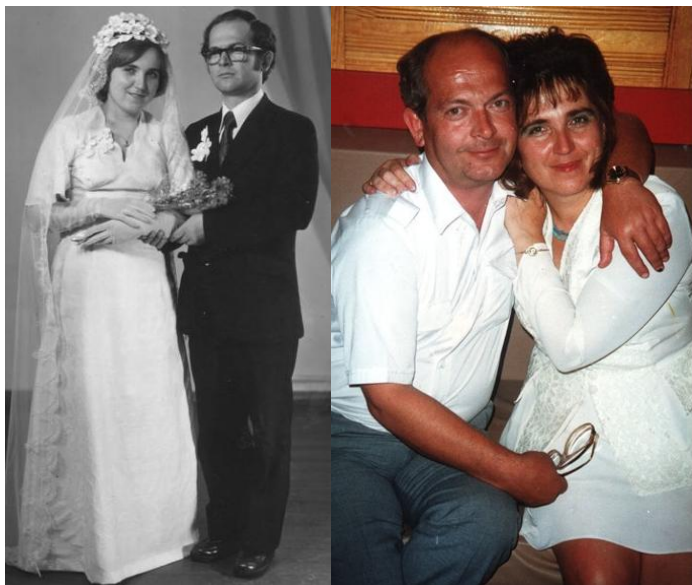
Разом – на все життя (1979 рік)