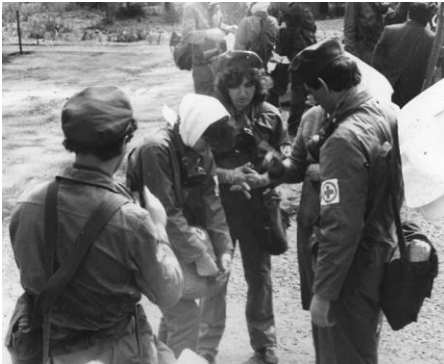
Змагання з цивільної оборони (1988 рік)