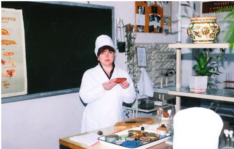
Заняття з ветеринарно-санітарної експертизи (2002 рік)