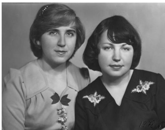
Подружки – Тетянки (1975 рік)