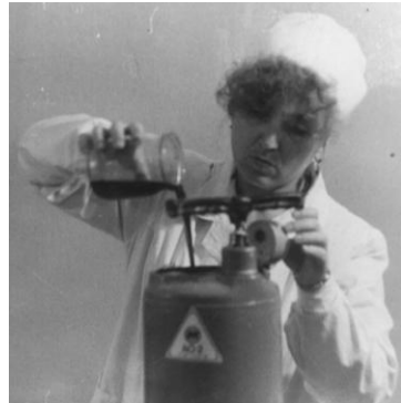
Експериментальні дослідження дезінфекційного препарату «Байфоміл» (1993 рік)