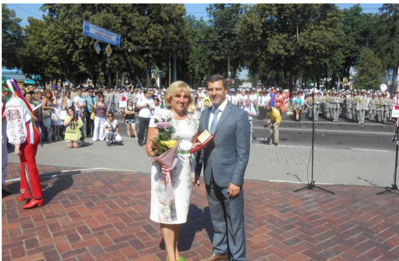
Вручення нагороди «Заслужений працівник ветеринарної медицини України» (2013 рік)