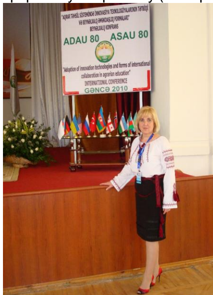
Проректор з наукової роботи СНАУ з дружиною в гостях у Азербайджанського державного аграрного університету (2010 рік)