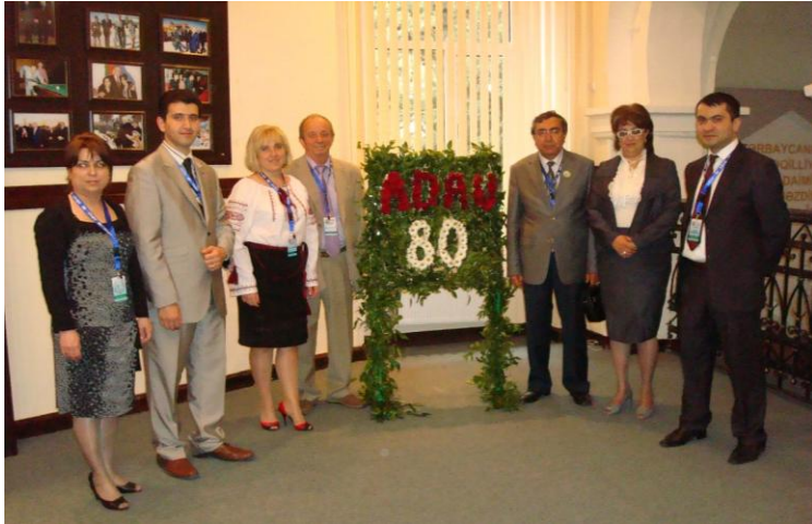
Святкування 80-річчя Азербайджанського державного аграрного університету (2010 рік)