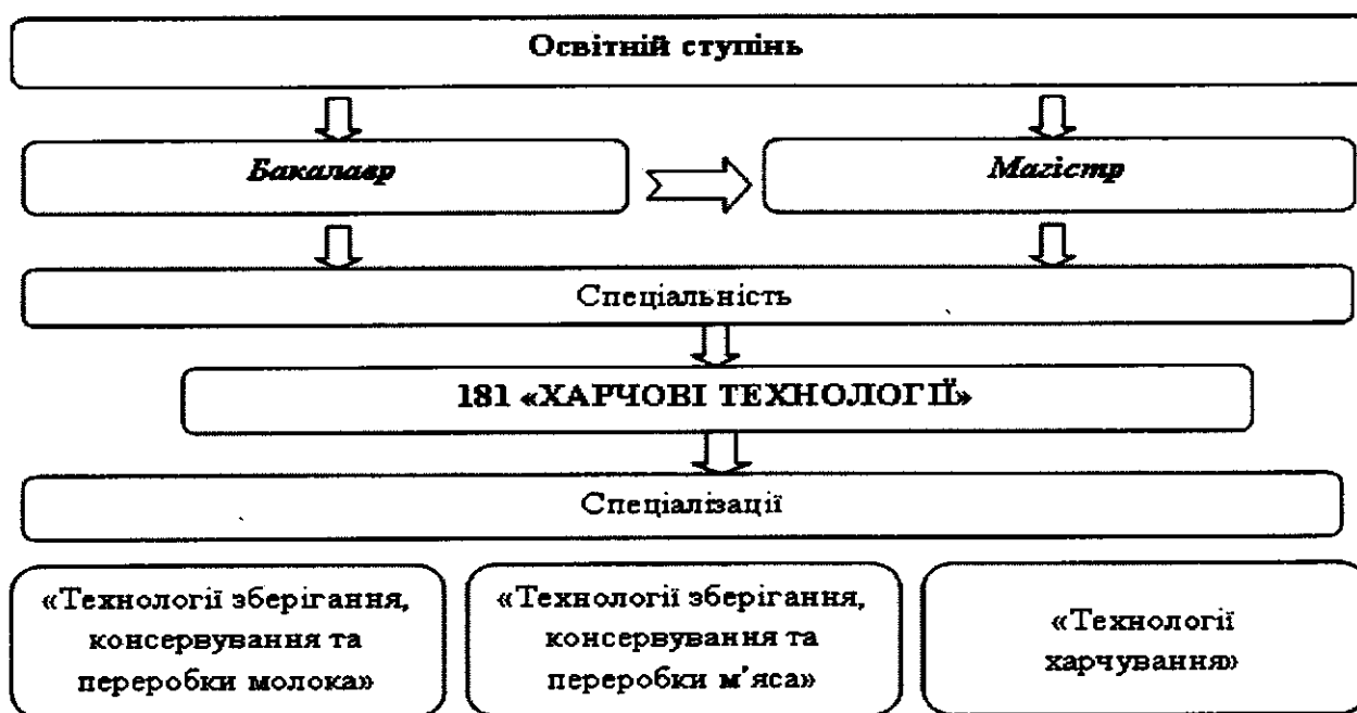
Рисунок 1 – Перелік спеціальностей і спеціалізацій факультету харчових технологій

Відповідно Переліку галузей та спеціальностей, який було затверджено постановою Кабінету Міністрів України, відбулися зміни в переліку спеціальностей підготовки фахівців з вищою освітою [1]. На факультеті харчових технологій були введені спеціалізації, які наведені на рис. 1