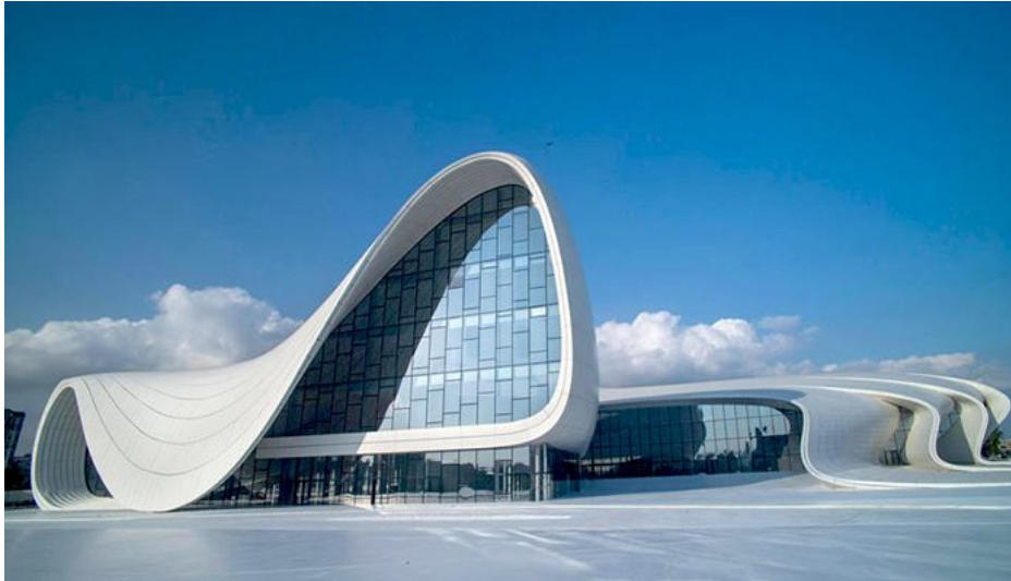
Рис.3 Емоційно-інтуїтивне домінування у побудові архітектурної композиції (Заха Хадід. Культурний центр Гейдара Алієва в Баку)

авторами їх здебільшого є визнані майстри з непересічним та невичерпним творчим потенціалом, які є головною рушійною силою у розвитку сучасної архітектурної композиції, архітектурної думки та ідеї. Володіючи емоційно-інтуїтивними методами генерації архітектурної композиції, маючи високий рівень професійності та духовності, такі зодчі справді створюють «музику, що застигла в камені».