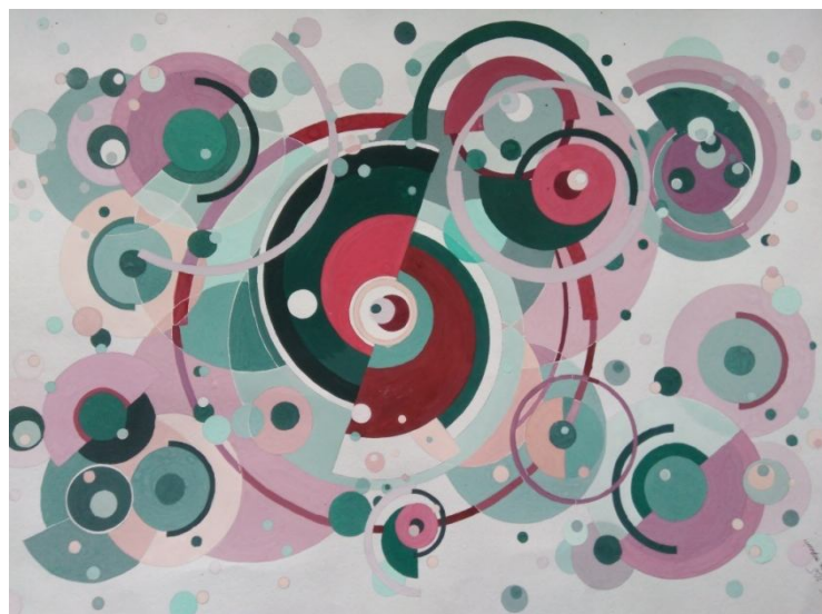
Рис.2 Колеристично активна динамічна композиція (студентська робота)

Важливим аспектом будь-якої композиції, зокрема архітектурної, є її колеристичне вирішення . Існує науково обгрунтована методика організації гармонійних колеристичних рішень яку вивчають студенти архітектурної спеціальності на заняттях з кольорознавства. Принципи комбінацій кольорів ґрунтуються на використанні контрастних та нюансних їх співвідношень у різних частинах композиції в залежності від загальної ідеї автора.