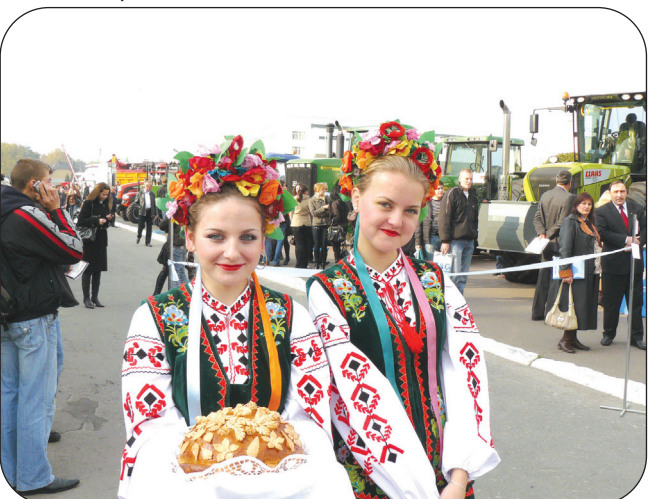
Відкриття міжнародної науково-практичної конференції «Аграрний форум-2008» на базі СНАУ 15 жовтня.