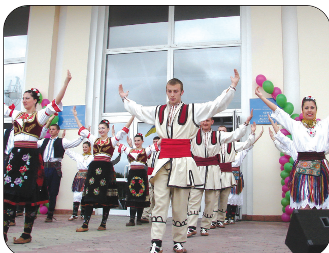
Дружній візит фольклорного колективу з Сербії наприкінці травня.