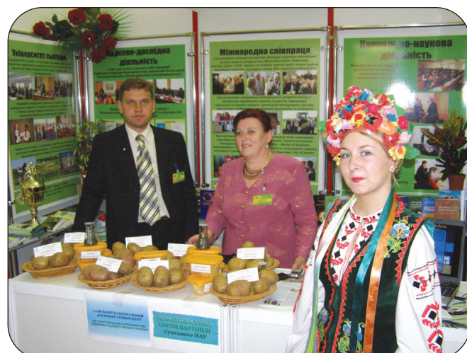
Сумський НАУ на ювілейній XX Міжнародній агропромисловій виставці-ярмарку «Агро-2008», що проходила в Києві 10-13 червня.