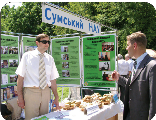
Наш університет вже традиційно взяв участь в обласній агропромисловій виставці-ярмарку «Агро-Сумщина - 2008», що відбулася 4 липня у с. Сад.