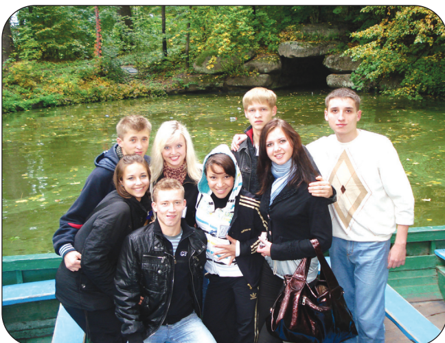
Учасники гала-концерту фестивалю «Софіївські зорі», що пройшов 3-4 жовтня у м. Умань.