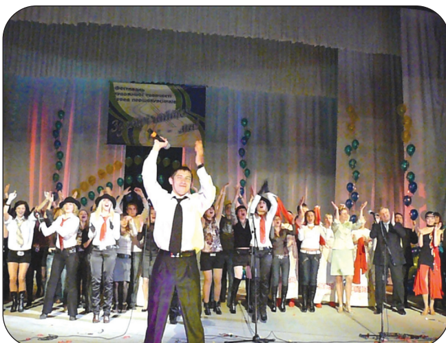
Гала-концерт фестивалю художньої творчості серед першокурсників «Зустрічайте: - це ми!» 29 жовтня.