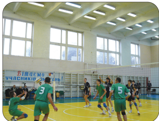
Змагання серед кращих волейбольних команд аграрних ВНЗ на Кубок Міністерства аграрної політики України, що проходили в СНАУ наприкінці листопада.