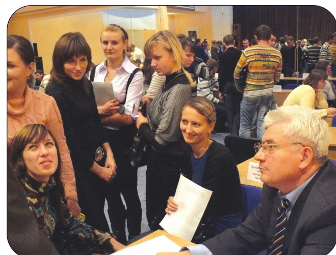
Ярмарок професій в Сумському НАУ 5 листопада.