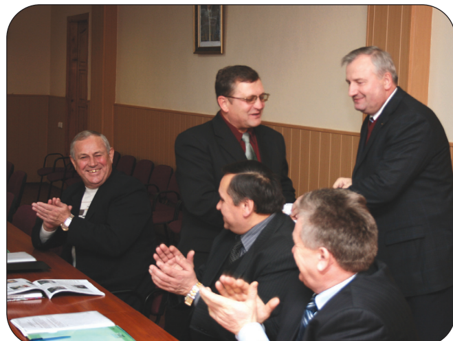
Перше засідання Наглядової ради СНАУ 22 листопада.