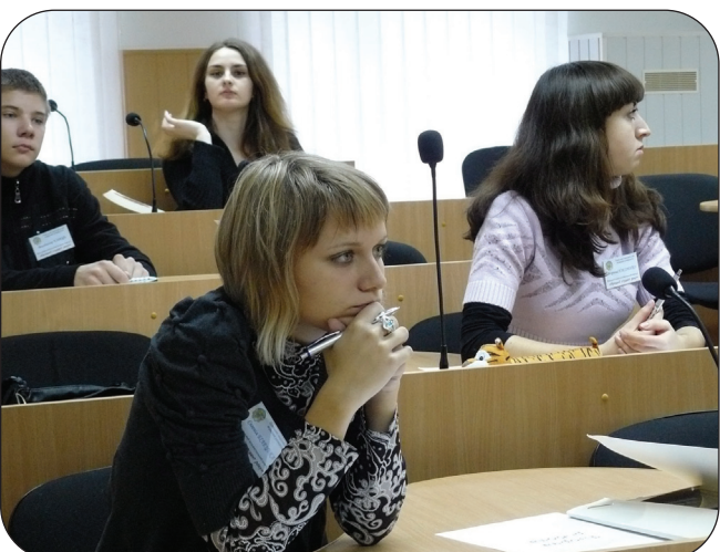
II тур Всеукраїнського інтелектуального конкурсу «Кращий студент року» в СНАУ, проведений 3 грудня.