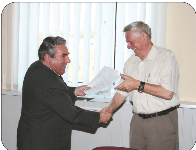
Візит до СНАУ делегації з Білорусі. Підписання угод про співпрацю між СНАУ та провідними білоруськими аграрними вишами 10 червня.