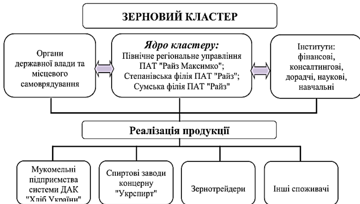
Рис. 2. Схематична модель зернового кластера Сумської області [9]

Зупинимося на першому з них – зерновому (рис. 2). На першому етапі пропонувалося наступне ядро кластеру [9]: Північне регіональне управління ПАТ «Райз-Максимко»; Степанівська філія ПАТ компанії «Райз»; Сумська філія ПАТ компанії «Райз».