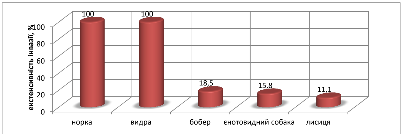
Рис. 1 Зараження дефінітивних хазяїв опісторхідами у природних умовах Сумської області

Ключову роль у циркуляції опісторхозу відіграють дикі м'ясоїдні тварини, що мешкають біля води. Встановлено, що зараження норки і видри досягає абсолютних величин. Необхідно відмітити, що у більшості заражених диких тварин у печінці, як правило, виявляли два види опісторхид: O. felineus , P. truncatum .