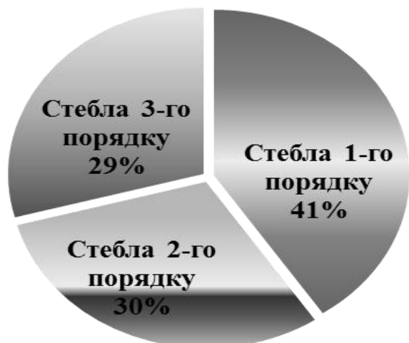
Рис. 1. Характер розподілу насіння між стеблами 1-го, 2-го та 3-го порядків у сорту Волошкова

Результати досліджень. У результаті проведених досліджень нами було встановлено, що матрикальна різноякісність насіння озимої пшениці проявляється за розмірами і масою насіння, яке формується у межах рослини на різних стеблах. Сорти суттєво різнилися за структурою розподілу насіння у межах рослини. Найбільш рівномірний розподіл насіння між стеблами 1-го, 2-го та 3-го порядків у сортів Волошкова і Розкішна (рис. 1,2). Більша частина насіння сформувалась на головних стеблах - 40,6-50,4 %, у стебел 2-го порядку - 30,2-36,4 %, 3 порядку - 22,3-25,3 %.