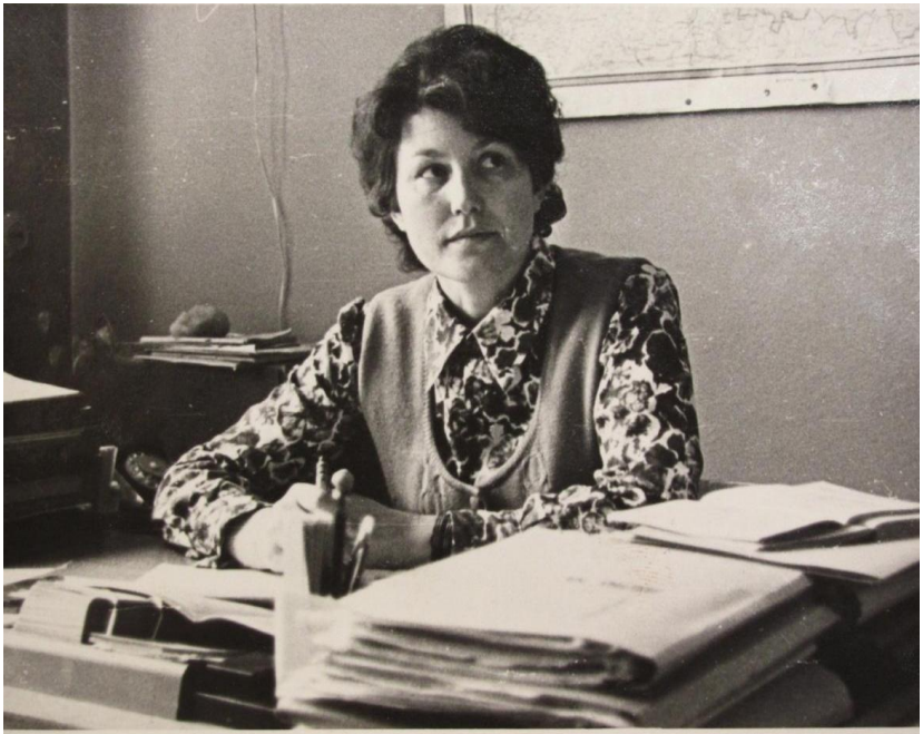
Асистент кафедри ботаніки Білоруської сільськогосподарської академії, 1965 р.