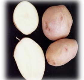
Селянська – 2010