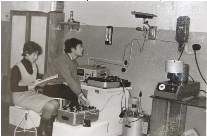
Аспірант Білоруського НДІ картоплярства і плодовоовочівництва, 1967 р.