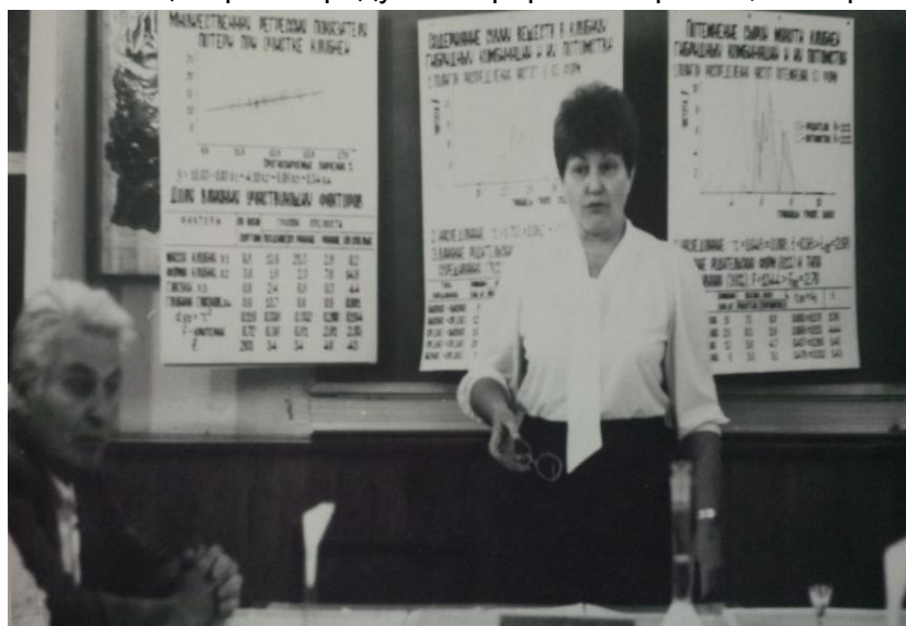
Доповідь дисертації на засіданні кафедри селекції та насінництва, 1993 р.