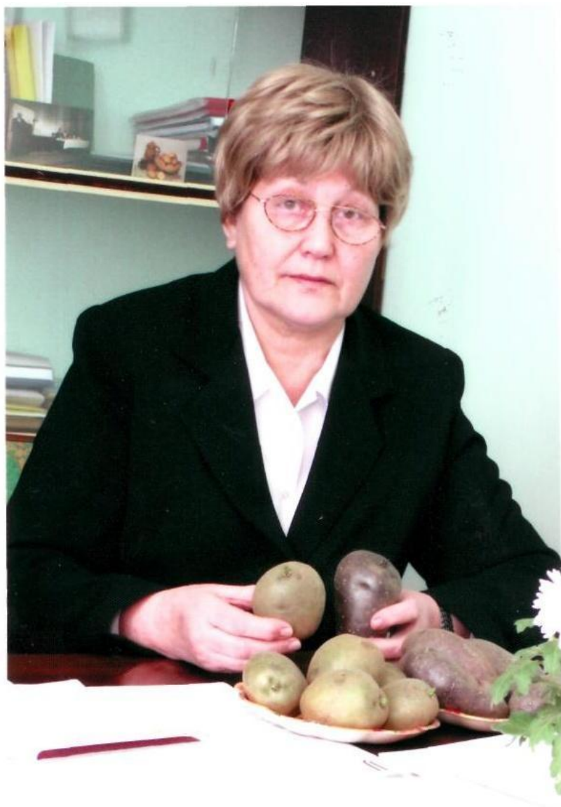
Завідувач кафедри ім. М.Д. Гончарова, 2010 р.