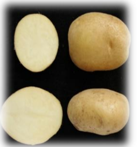
Слобжанка-2 – 2010