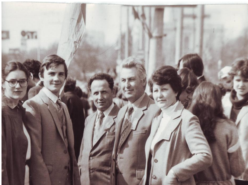
зборах колективу Сумського ДАУ, 1984 р.