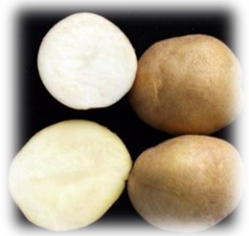
Фермерська – 2006