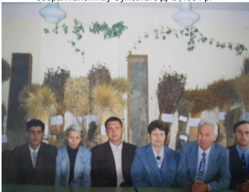
Колектив кафедри селекції та насінництва, 1989 р.