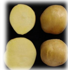
Смуглянка – 2017