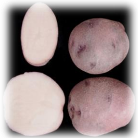
Псельська – 2011