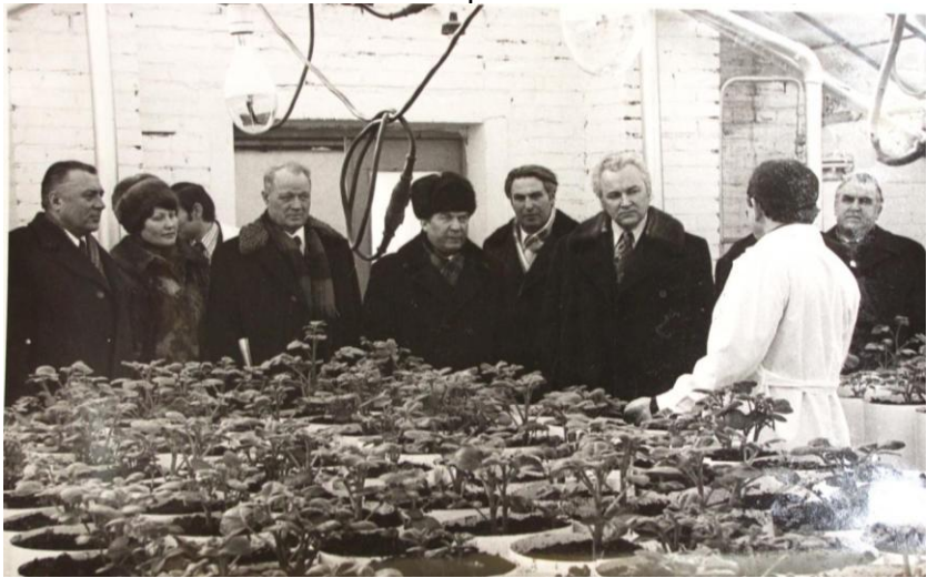
Делегація науковців Західного відділення ВАСГНІЛ у БілНДІКПО, 1978 р.