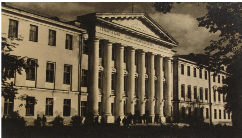
Білоруська сільськогосподарська академія (навчальний корпус), 1955 р.