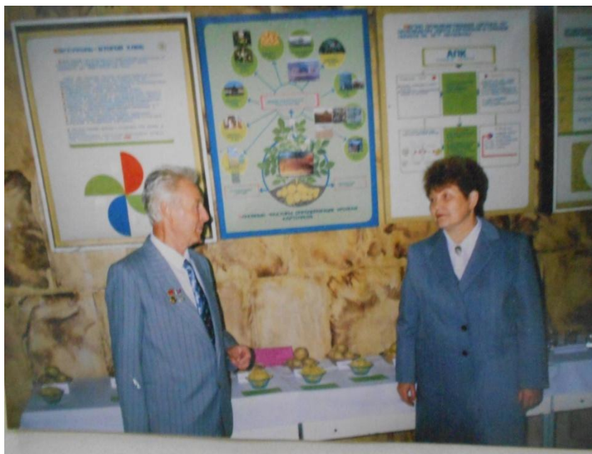
На виставці сортів і продуктів переробки картоплі, 1989 р.