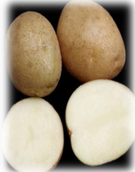
Ювіляр 60-70 – 2004