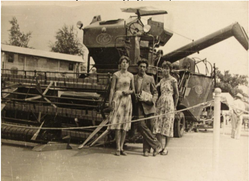
Експерсія студентів 4 курс Білоруської сільськогосподарської академії на ВДНГ СРСР, 1959 р.