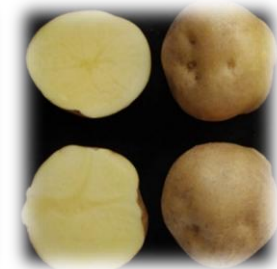
Гончарівська – 2017