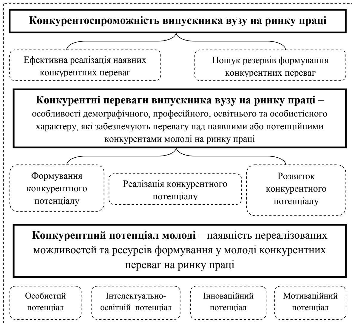
Рис. 1. Основні характеристики конкурентоспроможності випускника вузу на ринку праці [2, с. 20]

Сутність конкурентоспроможності випускника Вузу на ринку праці варто розглядати з огляду на певні ознаки, що її визначають, тобто складові конкурентоспроможності. Конкурентні переваги молоді на ринку праці формують, на нашу думку, три складових: демографічна (статеві-вікові особливості, стан здоров'я, сімейний стан), освітньо-професійна (рівень набутих теоретичних знань, вмінь та практичних навичок, кваліфікаційна відповідність, професійна компетентність) та особистісно-соціальна (культура та наявність моральних принципів, здатність до критики та самокритики, відповідальність, творчість, креативність, адаптивність, комунікабельність, організаторські навички,