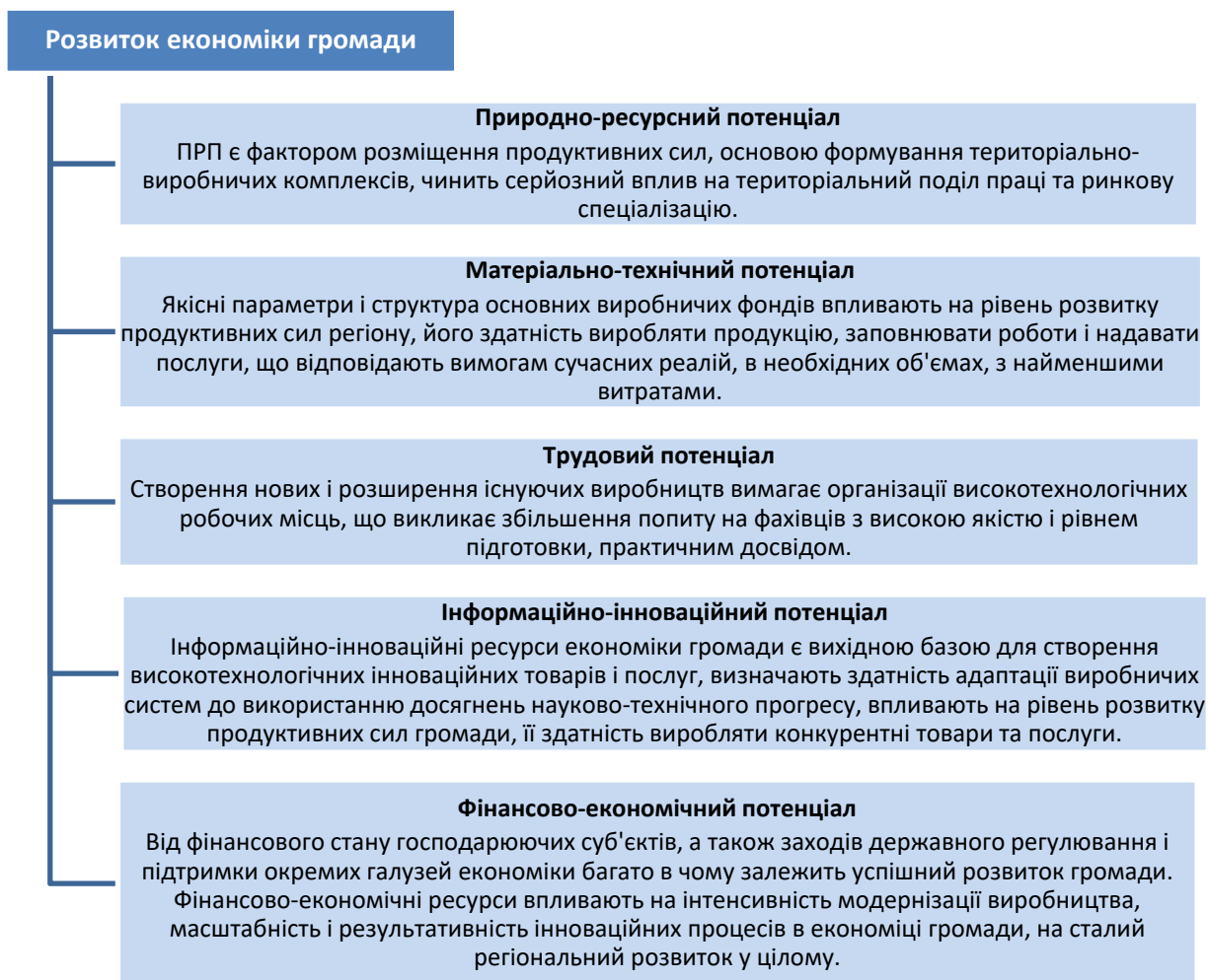
Рис. 2. Елементи ресурсного потенціалу громади

Широко використовується в даний час ресурсно-витратний підхід до оцінки потенціалу, він відображає лише одну сторону аналізу потенціалу і не включає в себе якісних характеристик 1 . Ми поділяємо думку про те, що оцінка потенціалу не повинна зводитися тільки до обліку ресурсів, а повинна передбачати виявлення здібностей та потенційних можливостей регіона. На наш погляд, необхідно не тільки визначати рівень використання потенціалу, але і обирати еталонні значення за показниками кожного елемента потенціалу. Не менш важливим вважаємо визначати резерви використання того чи іншого елемента потенціалу.