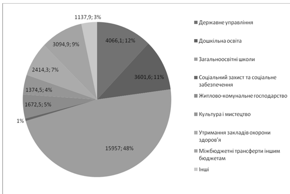
Рис.4. Структура видатків бюджету ОТГ, млн. грн. 1 .

Структура видатків бюджету громади, млн. грн., виглядає наступним чином (рис.4).