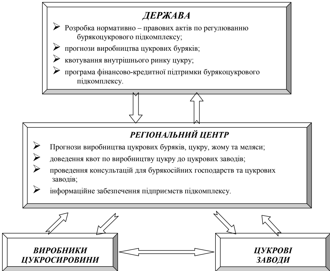
Рис.2. Схема пропонованого регулювання бурякоцукрового підкомплексу області.

Функції регіонального центру полягають у наступному: внесення пропозицій щодо поліпшення економічних взаємовідносин суб'єктів підкомплексу; прогнозування виробництва цукрових буряків, цукру, жому та меляси; доведення квот по виробництву цукру до цукрових заводів; проведення необхідного консультування підприємств підкомплексу з метою прийняття зважених рішень; своєчасність надання інформації підприємствам підкомплексу.