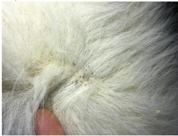
Рис. 2. Колонії волосоїдів Bovicola bovis на тілі тварин.

Комах легко виявляли шляхом ретельного візуального огляду, в шерстному покриві обстежуваних тварин (рис. 2)