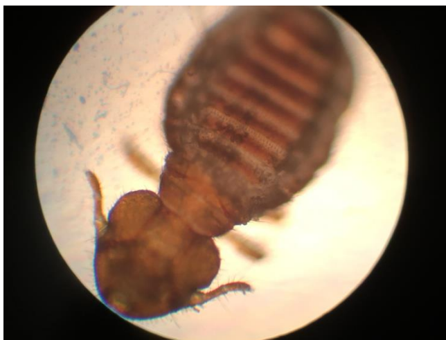
Рис. 1. Волосоїд Bovicola bovis

З родини Trichodectidae в обстеженого поголів'я було ідентифіковано волосоїд виду Bovicola bovis (рис. 1).