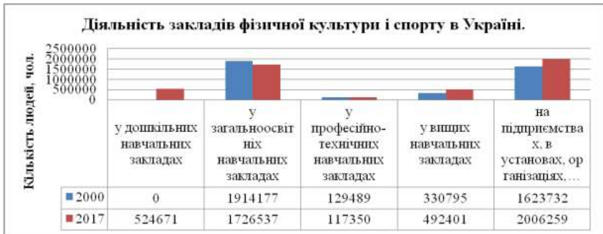
Рис.3 Діяльність закладів фізичної культури і спорту в Україні.

Так, у березні 2017 року Постановою Кабінету Міністрів №115 була затверджена Державна цільова соціальна програма розвитку фізичної культури і спорту на період до 2020 року. Метою Програми є визначення провідної ролі фізичної культури і спорту як важливого фактору здорового способу життя, профілактики захворювань, формування гуманістичних цінностей, створення умов для всебічного гармонійного розвитку людини, сприяння досягненню фізичної та духовної досконалості людини, виявлення резервних можливостей організму, формування патріотичних почуттів у громадян та позитивного іміджу держави у світовому співтоваристві [9].