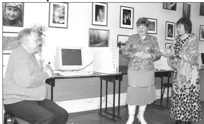
Національної спілки фотохудожників України.