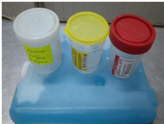
Рис. 1. Контейнери та хладоген для транспортування зразків фекалій

Збудник може закономірно змінювати фазу паразитизму на фазу сапрофітизму. Джерелами збудника інфекції можуть бути як дикі і сільськогосподарські тварини, так і абіотичні фактори зовнішнього середовища (грунт, вода, рослини тощо) (Корнієнко Л.Є., Недосєков В.В., Бусол В.О. та ін., 2009). Зважаючи на це, дослідників кишкового ієрсиніозу все більше цікавлять екологічні аспекти циркуляції збудника хвороби (Кортняк Б.М., 2006), з'ясування екологічних закономірностей існування патогенних ієрсиній в екосистемах ґрунту (Бренева Н.В., Марамович А.С., Климов В.Т., 2005), біоценотичні основи природної вогнищевості сапронозів (Литвин В.Ю., Пушкарєва В.І., Емельяненко Е.Н., 2004), пристосування збудника до сучасних умов існування (Сомов Г.П., Бузалева Л.С., 2002, 2004).