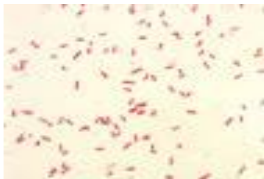
Рис. 3. Забарвлена за Грамом культура ієрсиній, х400

При вивченні морфології бактерій в мазках, що забарвлювали за Грамом, ієрсинії мали переважно паличкоподібну форму, із заокругленими кінцями завдовжки 0,8–1,2 і заширшки 0,5–0,8 мкм. В окремих мазках спостерігали і більш великі палички, розміром від 1,0 до 2,7 мкм завдовжки та 0,4–1 мкм заширшки (рис.3).