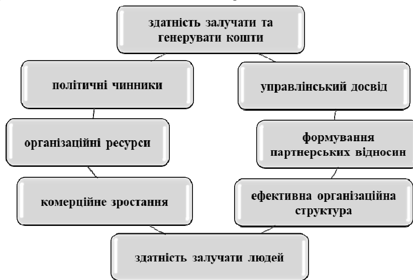
Рис. 4. Чинники стійкості соціального підприємництва

Отже, успішність соціального підприємництва в значній мірі заснована на використанні інноваційного підходу соціального підприємництва у вирішенні конкретної соціальної проблеми, використанні нової комбінації ресурсів, виведення на ринок нової послуги. Успішність соціального підприємництва може бути забезпечена шляхом ефективної взаємодії зацікавлених сторін. Найважливішим результатом соціального підприємництва є підвищення якості життя населення за рахунок знаходження нових способів вирішення соціальної проблеми. Систематизувавши чинники стійкості (рис 4) можна відзначити, що соціальне підприємство має бути економічно міцною та автономною організацією.