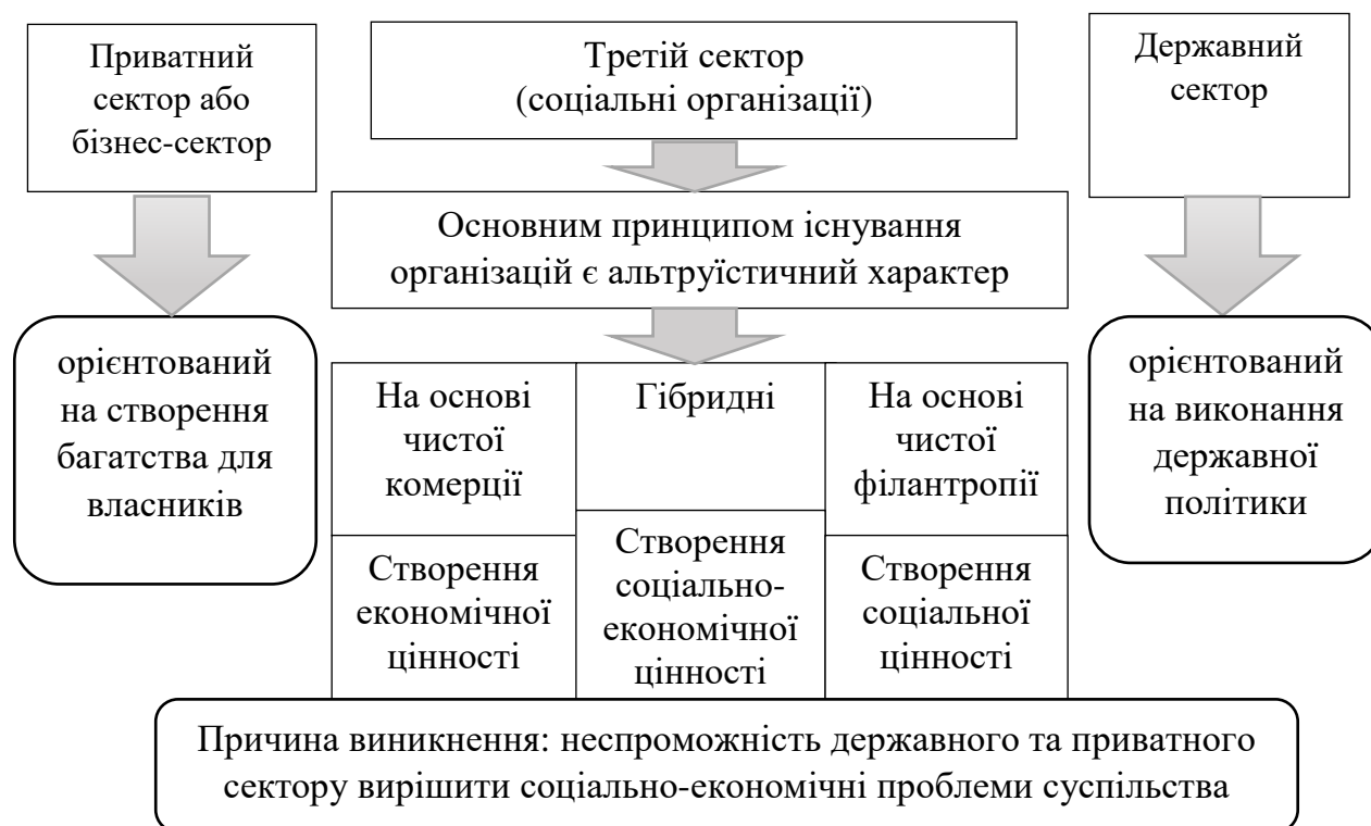
Рисунок 1. Місце третього сектору у вирішенні соціально-економічних проблем

У контексті соціального підприємництва важливо розуміти визначення кожного з трьох секторів (рис 1).