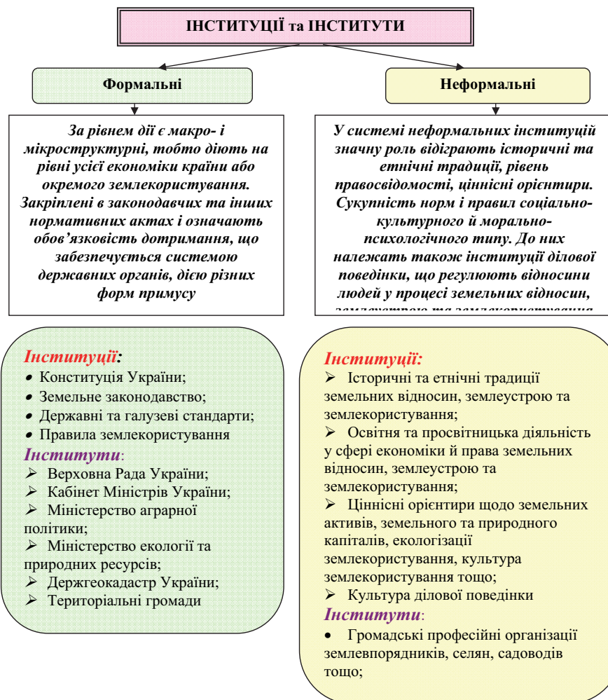
Рис. 2 Характеристика видів інституцій та інститутів

утворення «десь зовні»). Успішність роботи останніх базується на зрілості та відповідності одна одній формальній та неформальній інституції. Разом це єдина система, що формує соціально-економічну інституцію та інститут. За збалансованого і розвинутого стану усіх складових ця Інституція та Інститут є успішною або навпаки.