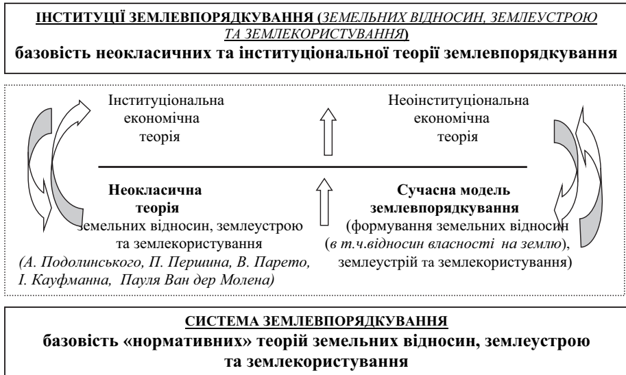
Рис.1 Теоретичні складові зростання сутності землепорядкування від «Системи» до «Інституції» (гіпотеза дослідження)

Саме рух землеустрою та землепорядкування від однієї із функцій управління земельними ресурсами до більш вагомшого і самостійнішого явища в економіці та екології яке обґрунтовує інституціонально-поведінкова теорія землеустрою та землепорядкування. У рамках нормативних теорій наявний на практиці розвиток соціально-економічної сутності землеустрою та землепорядкування не пояснюється, та більше того, обмежується теоретичними догмами. Застосувавши методи аналізу та синтезу до розгляду сучасного землеустрою та землепорядкування як суспільного явища, ми прийшли до висновків, що землепорядна наука відповідає всім теоретичним ознакам соціально-поведінкової науки в цілому, так і економічної інституції зокрема.