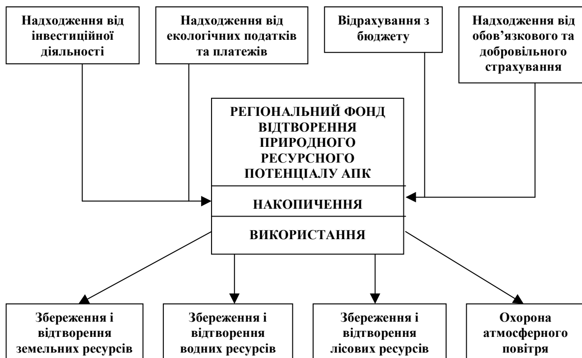
Рис. 3. Блок-схема формування та використання коштів на відтворення природного ресурсного потенціалу АПК

Використання земельних ресурсів в Україні є платним, а плата за землю справляється у вигляді нарахування земельною податку для власників землі та землекористувачів, платежі від якого зараховуються на спеціальні рахунки бюджетних місцевих рад. Ці кошти доцільно використовувати виключно для фінансування раціонального використання родючості земель. Крім того, додатковими джерелами стимулювання за підвищення ефективності землекористування можуть бути платежі в бюджет при вилученні малопродуктивних земель з сільськогосподарського обігу та кошти від сплати штрафних санкцій за користування землею.