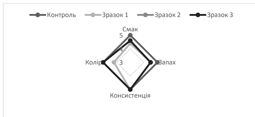
Рис. 2. Результати органолептичної оцінки готового продукту.

Для оцінювання органолептичних показників якості дослідних зразків булочок використали загальноприйняті методики та нормативні документи (ДСТУ 7044:2009 [8], ДСТУ-П 8536:2015 [9]). Результати органолептичної оцінки представлено у вигляді профіллограми на рис. 2.