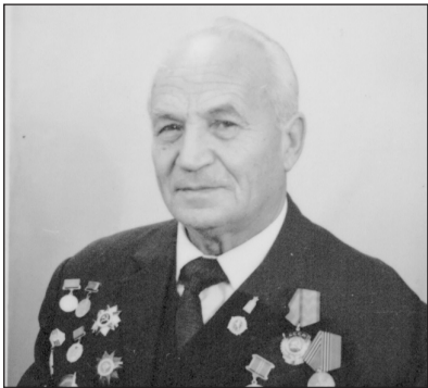
До 100-річчя з дня народження В.Т. Лобанова