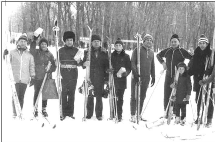
На «Лижні здоров'я» зі співробітниками та їх дітьми. Суми, 1986 рік

І це, на наш погляд, найкращий портрет сумського проміжку життя В.Т. Лобанова.