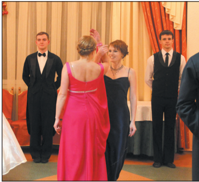
У лютому в СНАУ – Віденський бал!