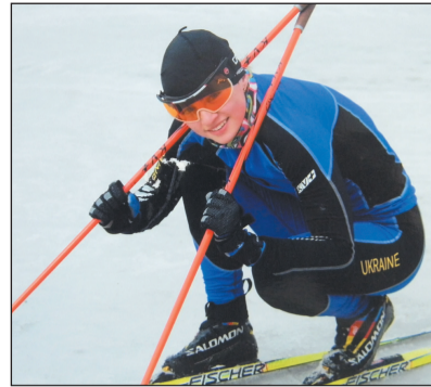
Старти кращих спортсменів