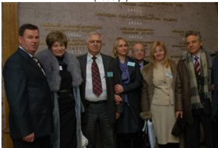
На науковій конференції разом з колегами з НУБІП (2009 р.)