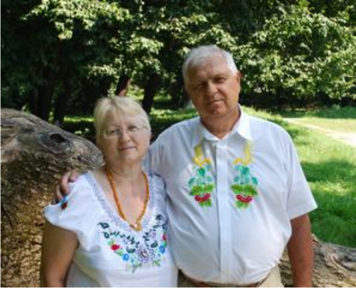
Разом з дружиною. На зустрічі випускників. Новочорторийський парк (2014 р.)