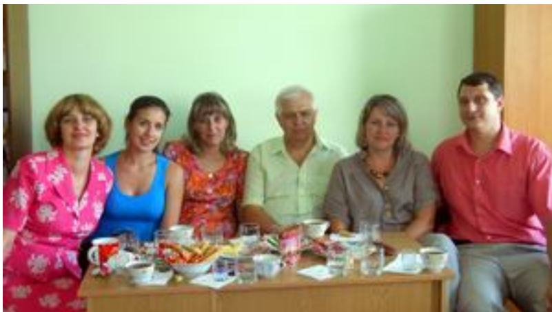
У колі своїх аспірантів (2012 р.)