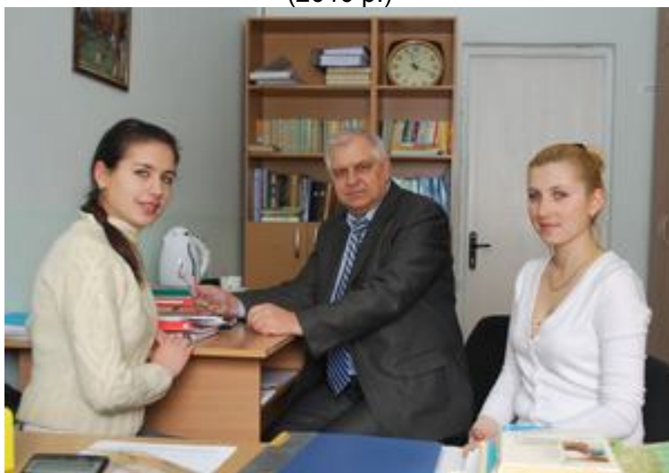
Робота зі студентами-дипломниками (2010 р.)