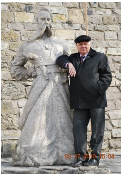
У Кам'янець-Подільському (2010 р.)