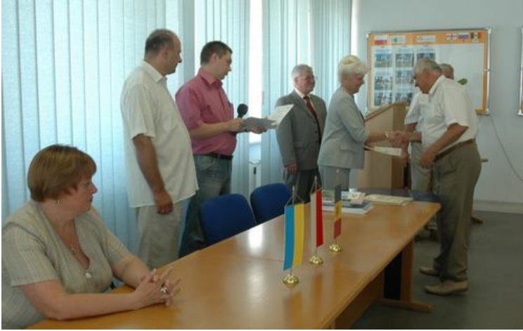
Вручення посвідчення про навчання у Польщі (2009 р.)