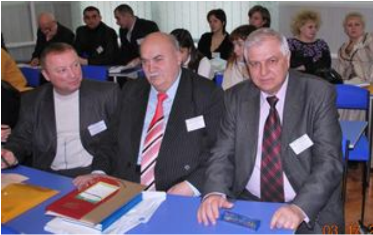
Участь у міжнародній науково-практичній конференції. Кам'янець-Подільський ДАТУ (2010 р.)