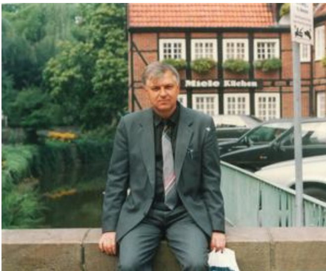
Стажування в Німеччині (1996 р.)