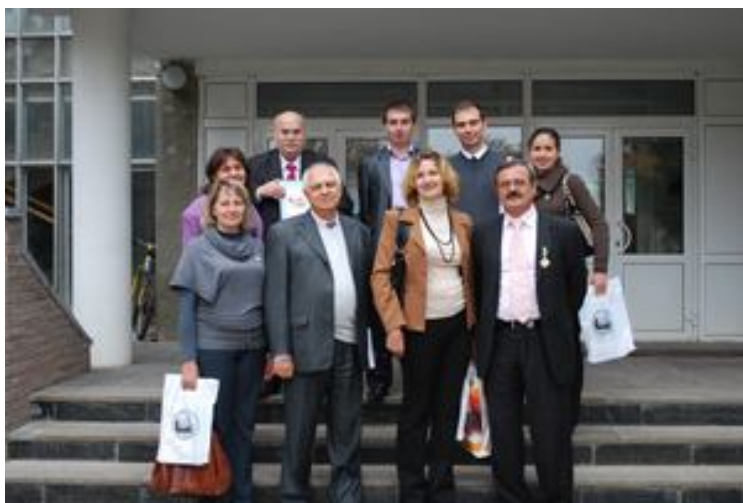
Участь у конференції в Інституті розведення і генетики тварин НААН (2012 р.)