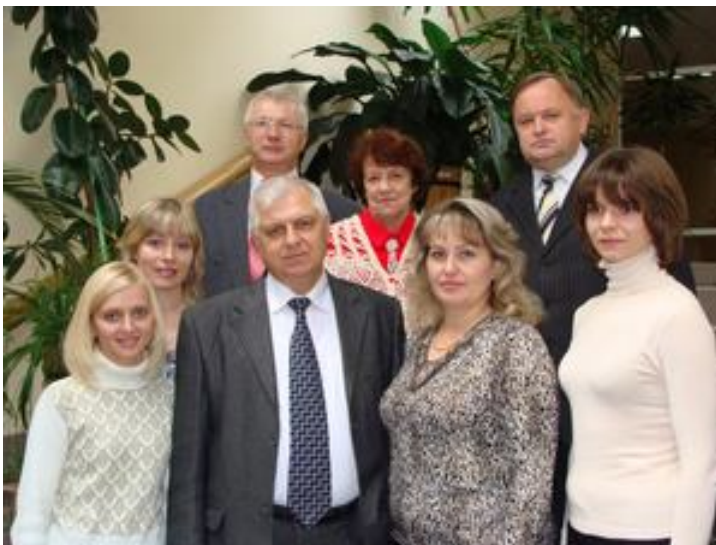
У складі кафедри розведення і селекції тварин Сумського НАУ (2008 р.)