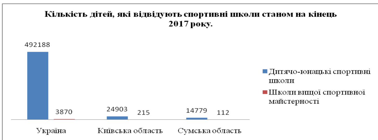
Рис. 2. Відвідуваність спортивних шкіл в регіонах України.

Висока значимість послуг фізичної культури і спорту вимагає вирішення проблем організаційно-економічного функціонування її інфраструктури. Актуальна оцінка її фактичного стану і обґрунтування стратегії розвитку на майбутній період.