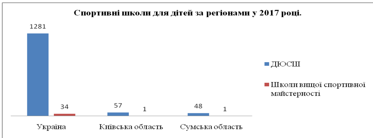
Рис.1 Кількість спортивних шкіл в регіонах України.

Висока значимість послуг фізичної культури і спорту вимагає вирішення проблем організаційно-економічного функціонування її інфраструктури. Актуальна оцінка її фактичного стану і обґрунтування стратегії розвитку на майбутній період.