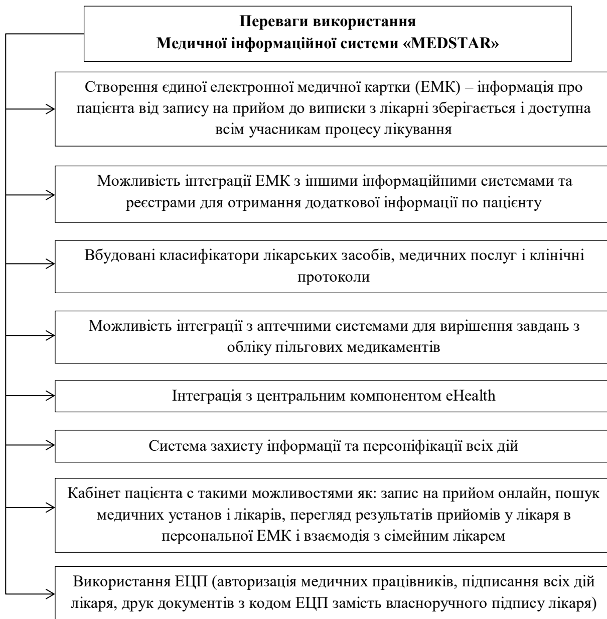
Рис. 2. Основні переваги використання МІС «MEDSTAR»

Вважається, що головними перевагами даної медичної інформаційної системи для медичних працівників та пацієнтів будуть наступними (рис.2).