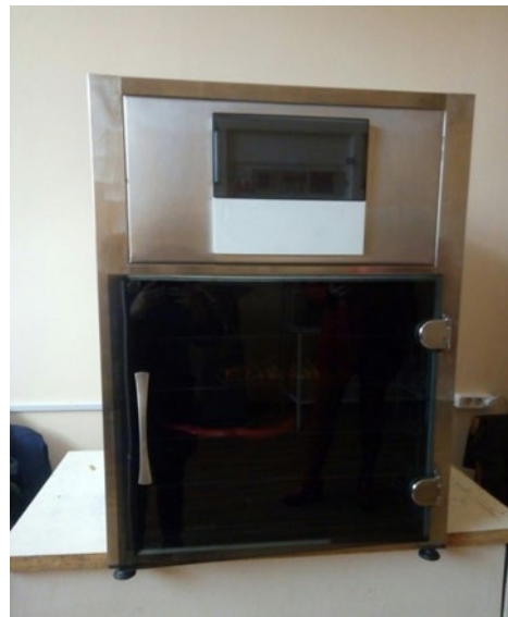
Рисунок 1. Сучасна установка для сушіння SH-1