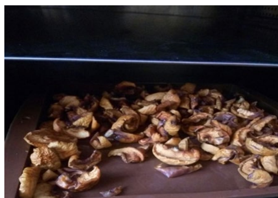
Рисунок 2. Зовнішній вигляд висушених грибів (вигляд зсередини)

грибна сировина за 8 год. при температурі 60 °С висушується на 87 % та зберігає свою структуру і поживні речовини (рис.2).