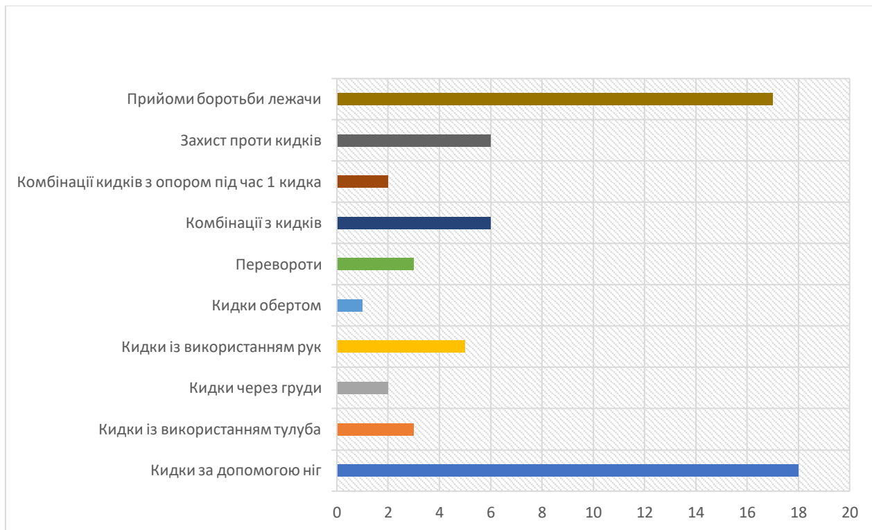
Рис. 2. Основні групи техніко-тактичних дій боротьби самбо (спортивний розділ)

кидки із використанням рук; 5) кидки обертом; 6) перевороти; 7) комбінації з кидків; 8) комбінації, які розвиваються під час опору супротивника в процесі першого кидка; 9) захист проти кидків; 10) прийоми боротьби лежачи.