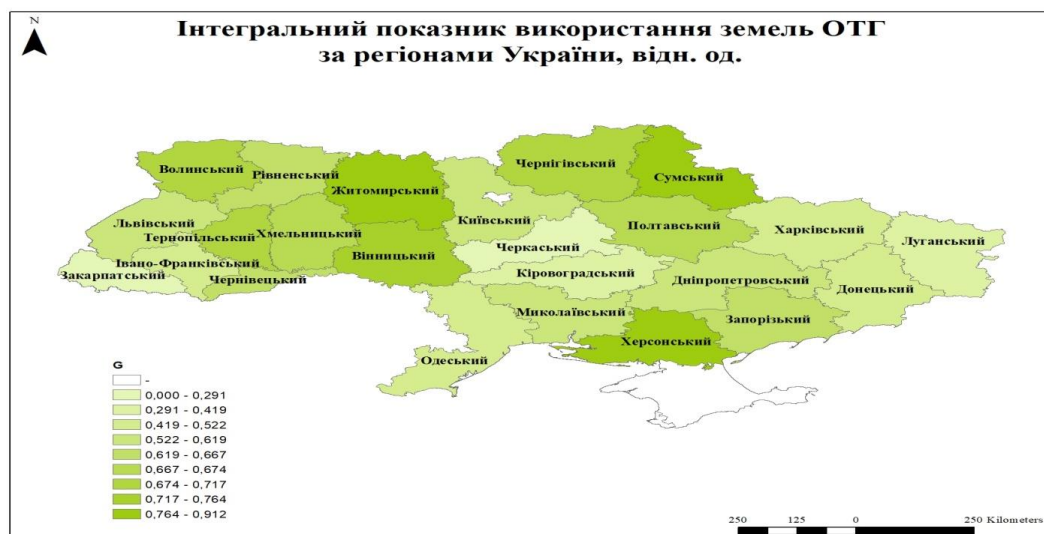
Рисунок 1 – Моніторингова ГІС-карта інтегрального показника використання земель ОТГ за регіонами України, відн. од. (розроблено автором)

Застосування геоінформаційних систем для моделювання, оцінки та аналізу інтегрального й узагальнюючих показників використання земель об'єднаних територіальних громад дає можливість сформулювати моніторингову основу для прийняття рішень щодо використання земель ОТГ. Сформовані етапи дозволяють візуалізувати зміни валового регіонального продукту на одиницю площі, визначити напрями його змін у визначеній перспективі залежно від напрямів та особливостей використання земель об'єднаних територіальних громад. Отже, у результаті застосування ГІС інструментарію на основі визначених даних побудовані моніторингові ГІС-карти показників використання земель ОТГ та валового регіонального продукту (рис. 1 – 2), враховуючи просторові, містобудівні соціально-економічні й екологічні особливості.