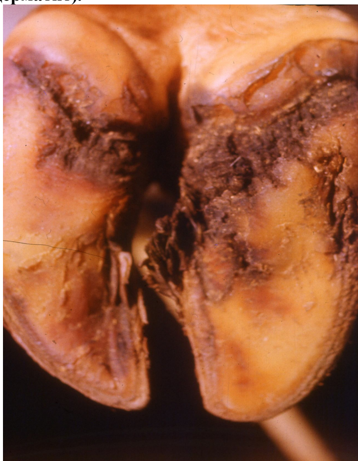
Рис. 3.3.7. – Хронічний ексудативно-асептичний пододерматит (дифузний пододерматит).