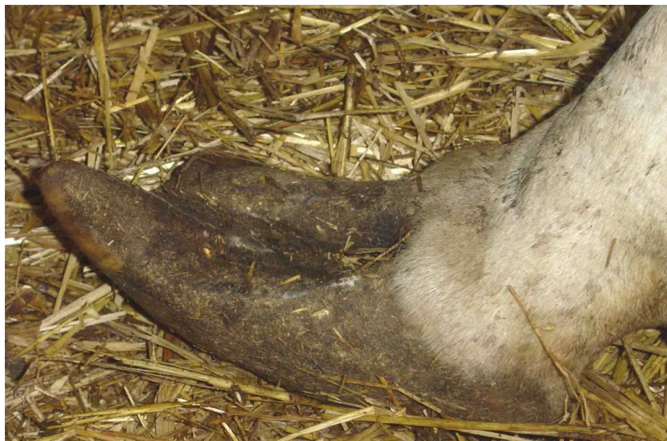
Рис. 3.3.2. - Деформація рогу копитаць (гострокінцеві копитця).