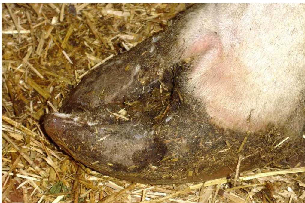
Рис. 3.3.3. - Деформація рогу копитаць (криві копитця).