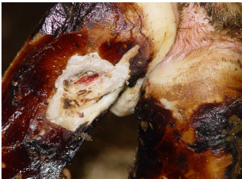
Рис. 3.3.5. - Вогнищево-дрібногематомний пододерматит (намулення).