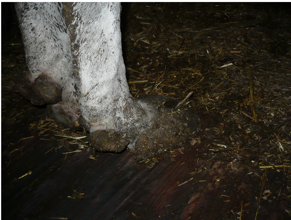
Рис. 3.3.4. - Дистрофічний остеотендиніт сухожилка глибокого згинача пальця з надмірним прогинанням путового суглобу.