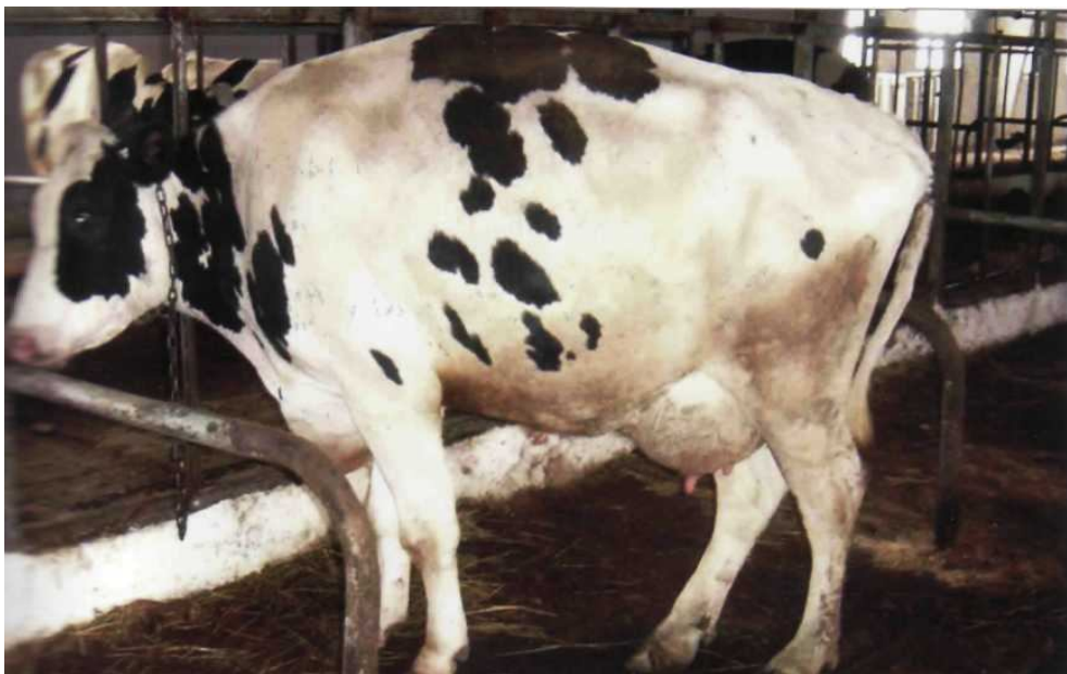
Рис. 3.3.8. – Підведення тазових кінцівок та викривлення хребта за гострого ексудативно-асептичного пододерматиту.