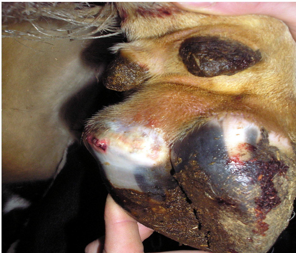
Рис. 3.3.6. – Гострий ексудативно-асептичний пододерматит (дифузний пододерматит).