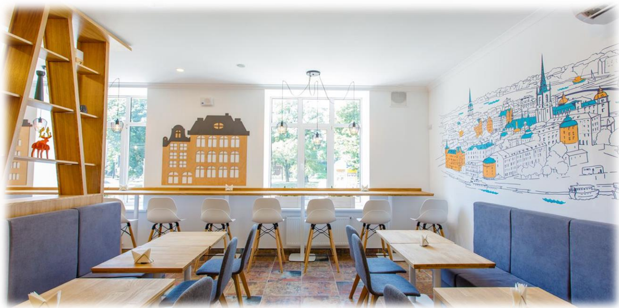
Рис. 3.5. вул. Воскресенська кафе «Fika»

Заклучний етап: Закриття квесту (15 хвилин):