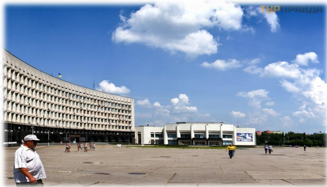
Рис. 3.6. Площа Незалежності

Вручення всім учасникам пам'ятних сертифікатів про проходження квесту.