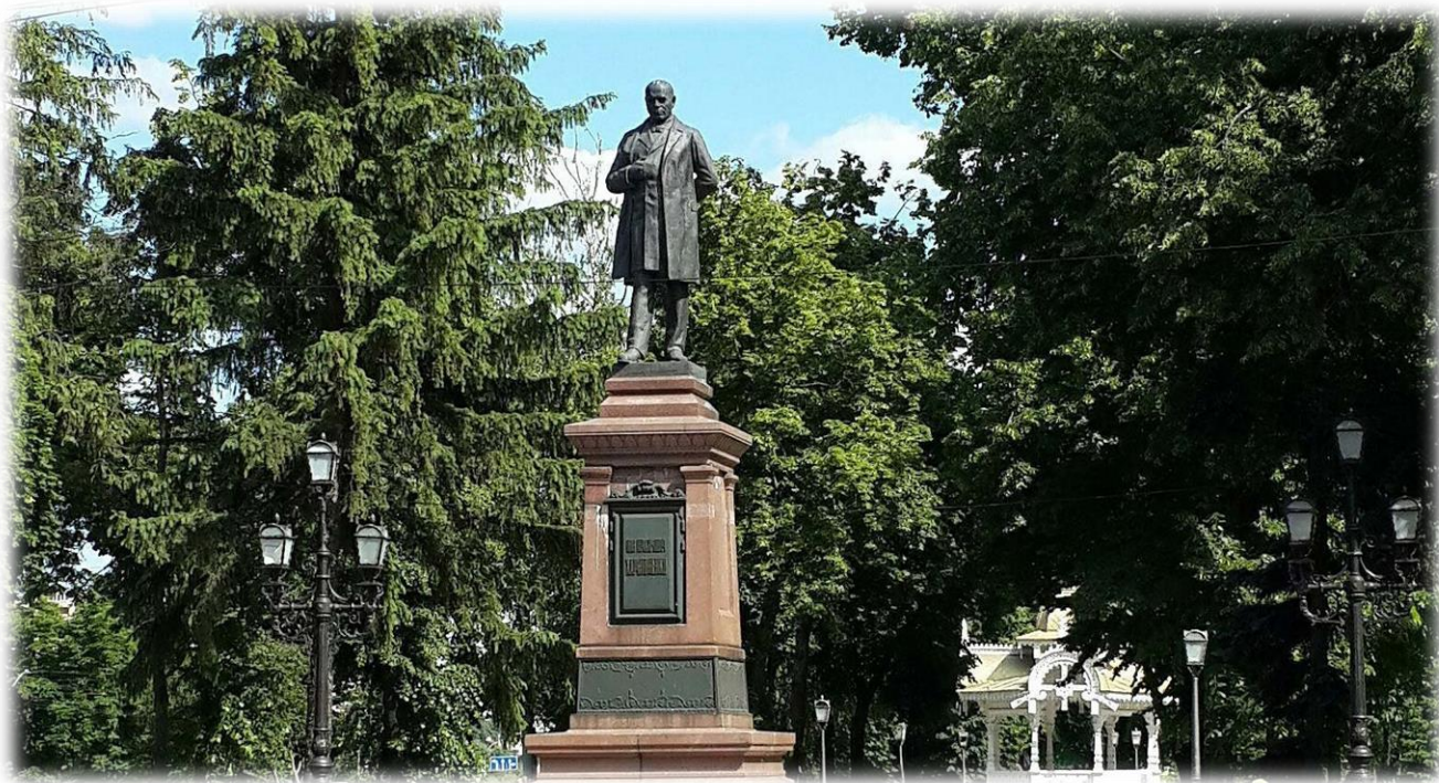
Рис. 3.2. Пам'ятник Івану Харитоненку

Етап 2: Історична реконструкція (20 хв):