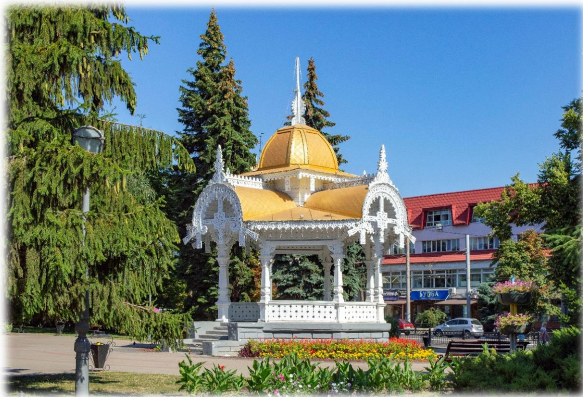
Рис. 3.3. Сумська Альтанка

Етап 3: Культурне споглядання (30 хвилин):