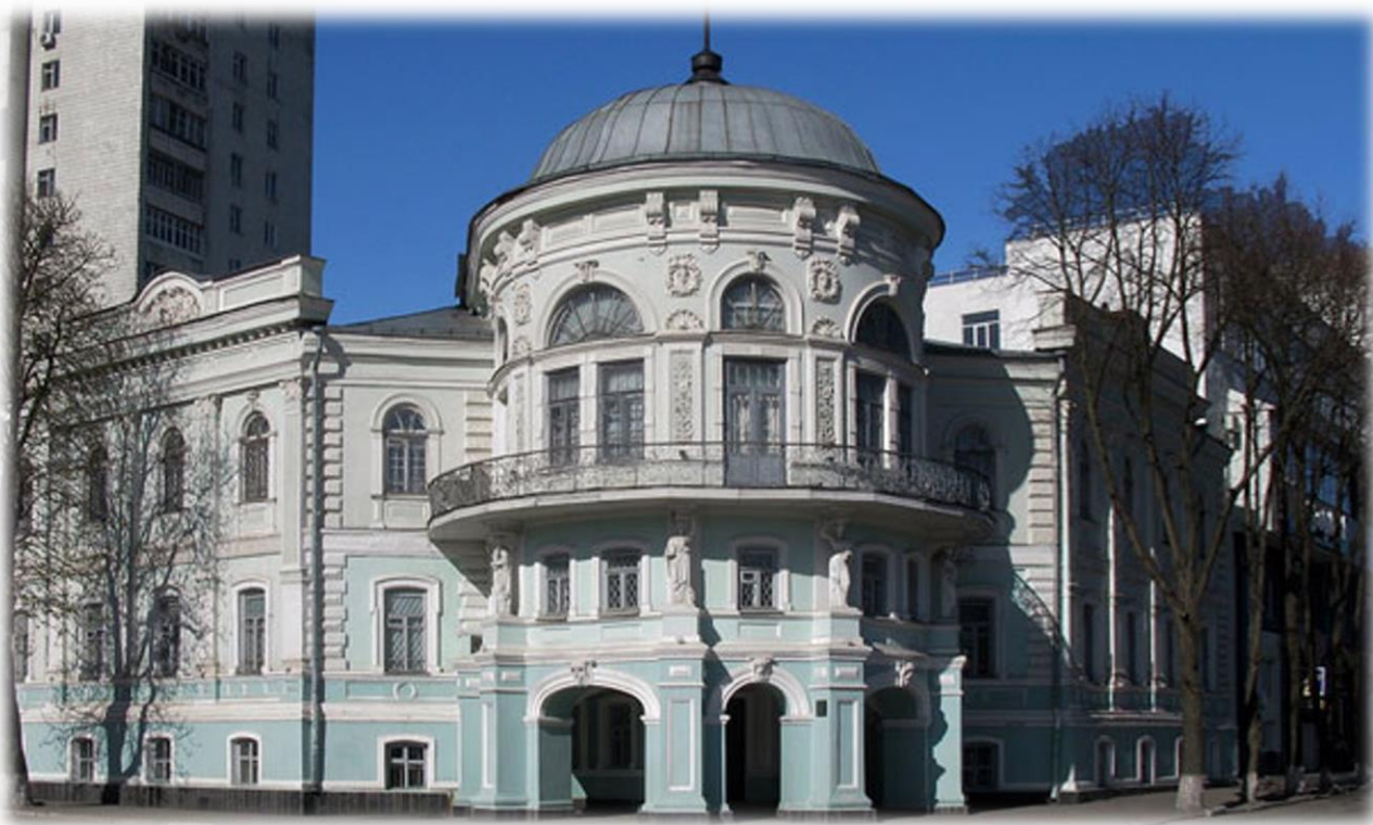
Рис. 3.4. Сумський краєзнавчий музей