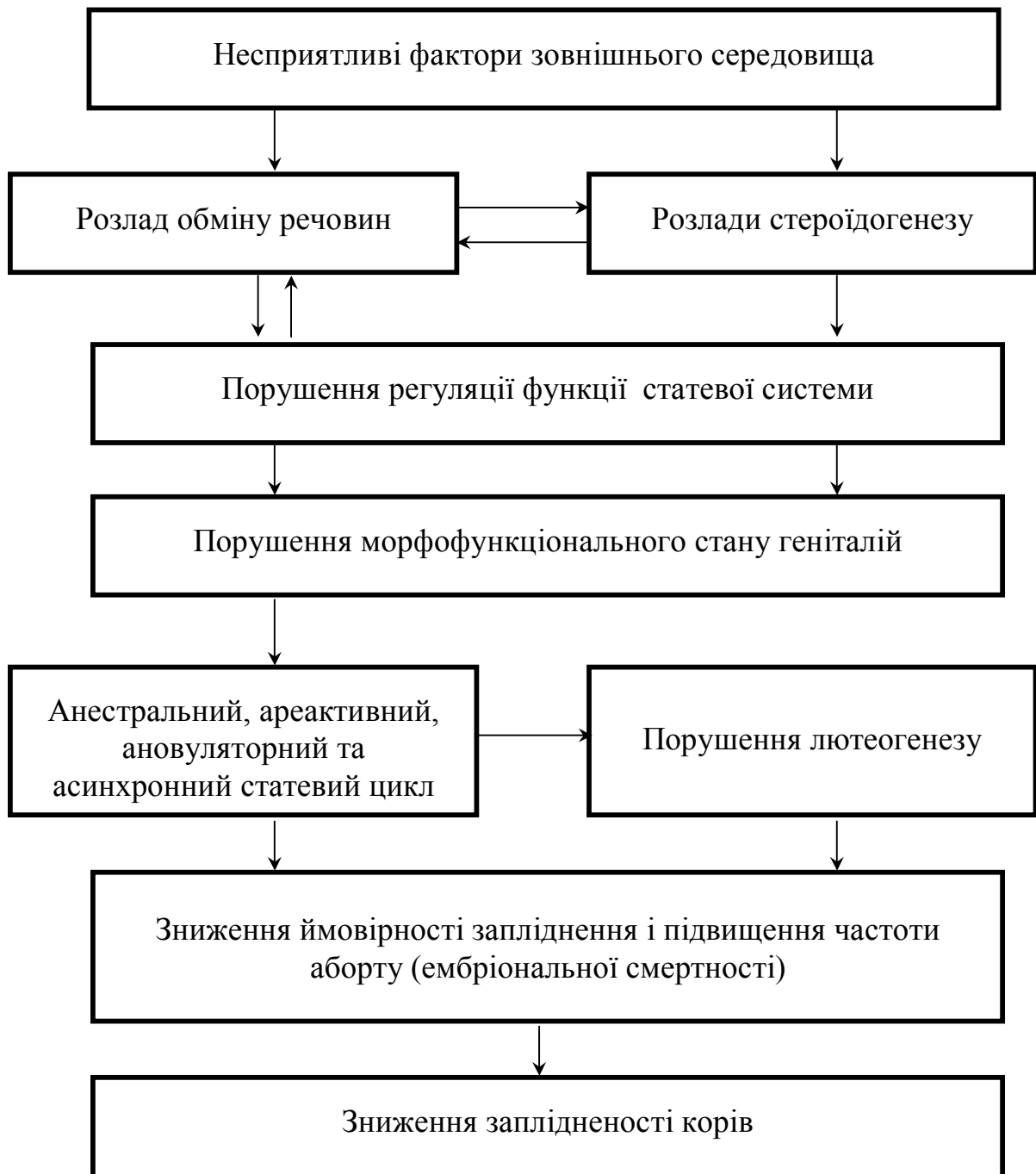
Рис. 3.5.3 - Механізм зниження заплідненості корів

порушує розвиток жовтого тіла і його функцію. Зазначені розлади супроводжуються зниженням ймовірності запліднення і підвищують частоту ембріональної смертності.