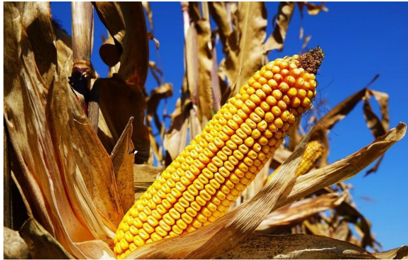
Рис. 3.1. Гібрид кукурудзи П8521 (P8521) від виробника "Піонер (Pioneer)"

відзначається високою врожайністю, яка потенційно може досягати 9 т/га за сприятливих умов.