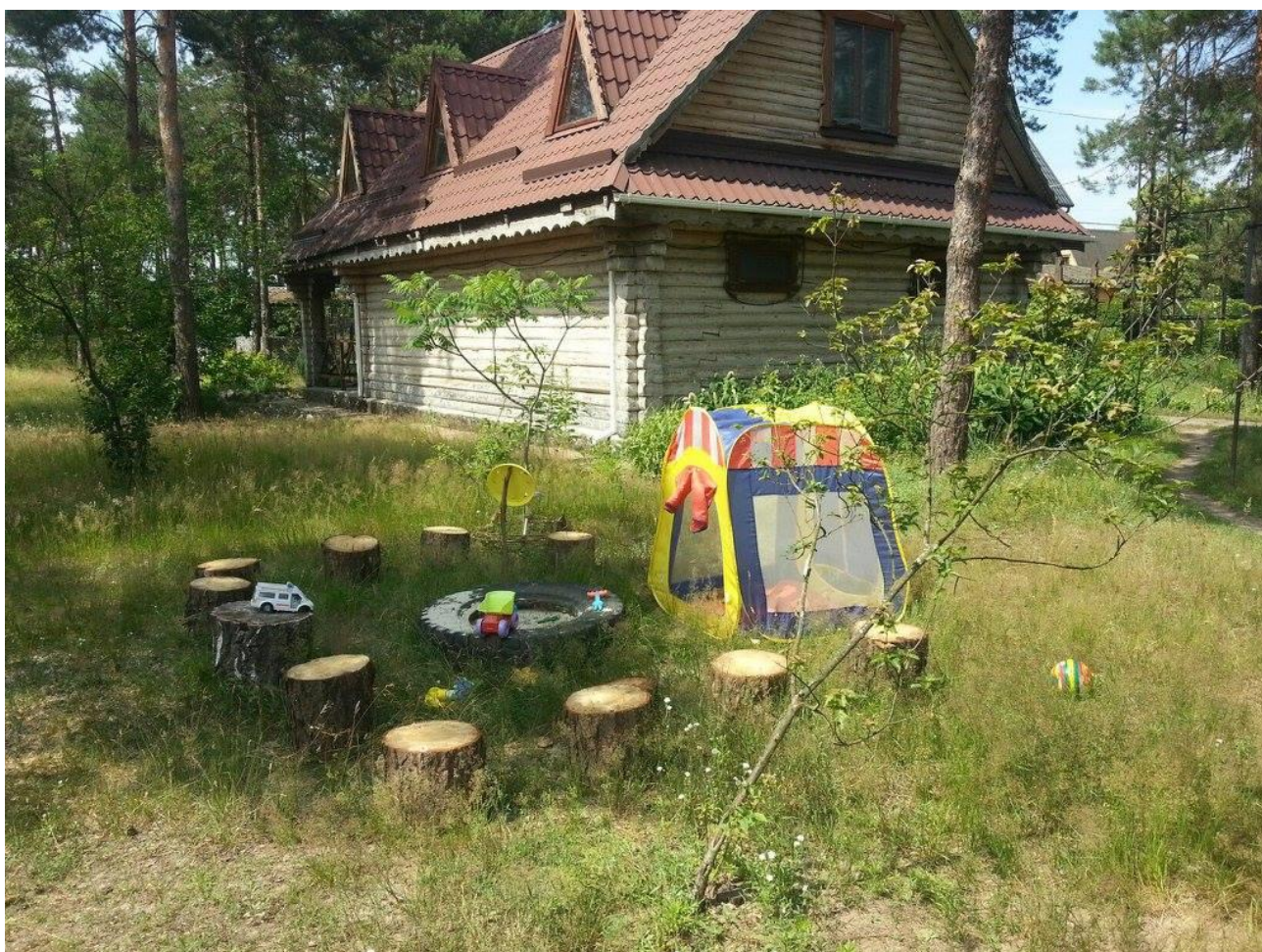
Рис. 3.2. Занедбаність зворотного від вулиці боку садиби

На перший погляд садиба «Північний ліс» досить добре облаштована, але все ж таки є і певні недоліки, такі як не доглянутість (рис. 3.2.). Із протилежного від вулиці боку кидаються в очі потріскані стіни та брудні вікна садиби, занедбаний задній двір.