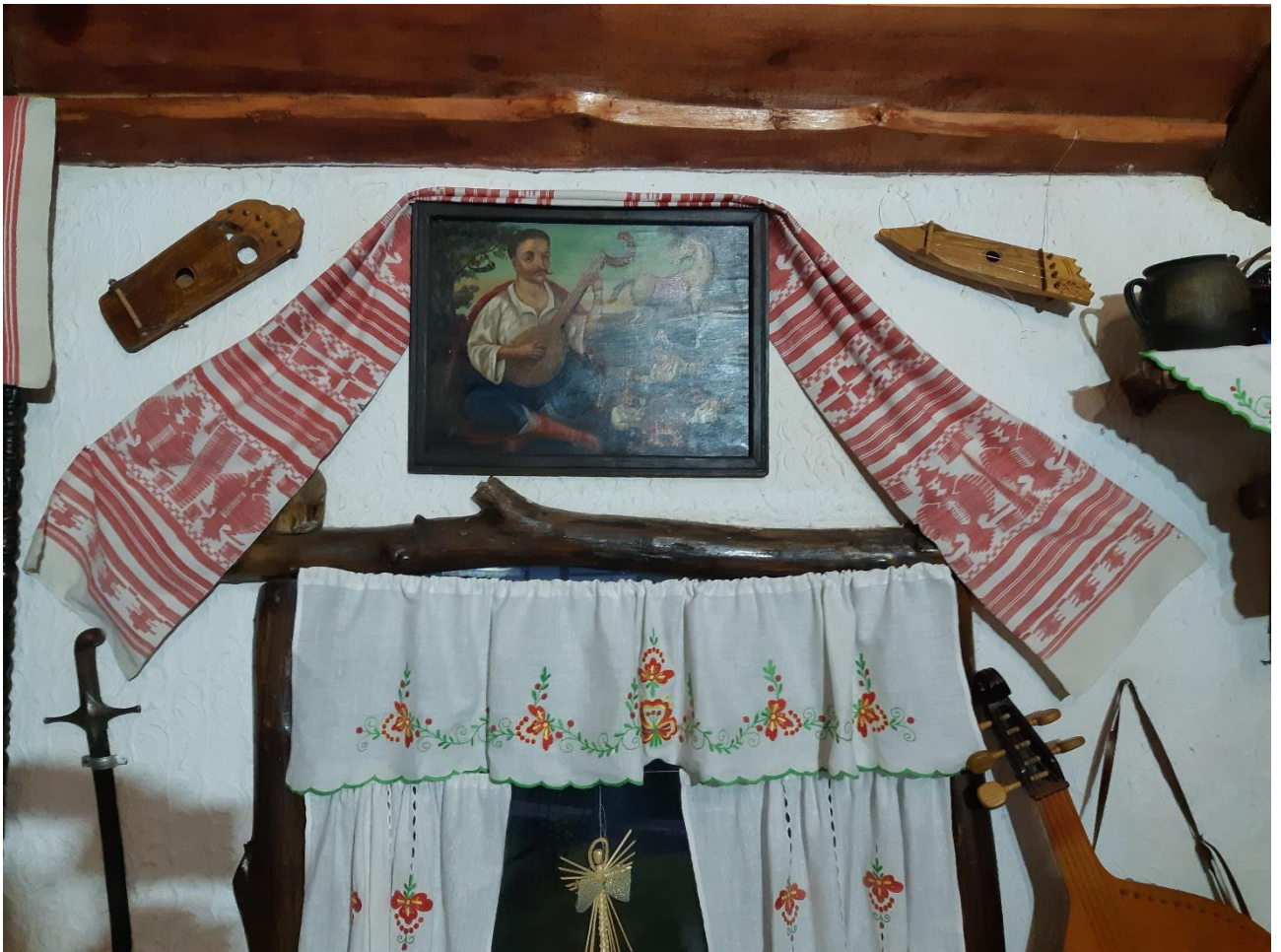
Рис. 3.1. Внутрішній інтер'єр однієї із кімнат садиби «Північний ліс»

Взагалі ця садиба дуже гарно облаштована в етнографічному стилі: вишиті та ткані рушники, старовинні меблі, автентичні предмети побуту: веретено, самовар, великі скрині для речей. Все це гарно імпонує та створює атмосферу типового українського села (рис. 3.1.).