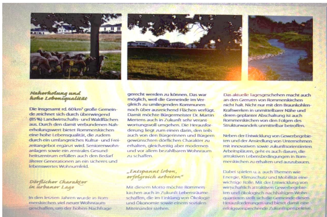
Рис.2.14 (Брошура на сайті місцевого самоврядування, з вищеописаною інформацією).

Тож креативний підхід, цікаві пропозиції – це як одна із рекомендації, яку б хотілось надати управлінню (Рис.2.14).