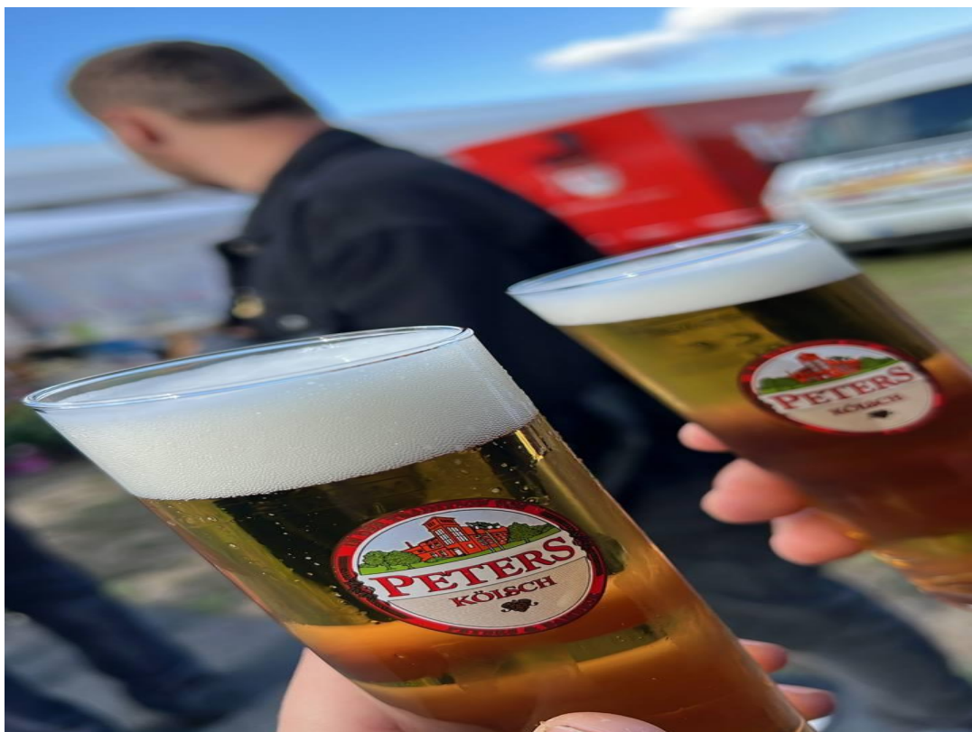
Рис. 2.7 Свято Пива (OctoberFest)