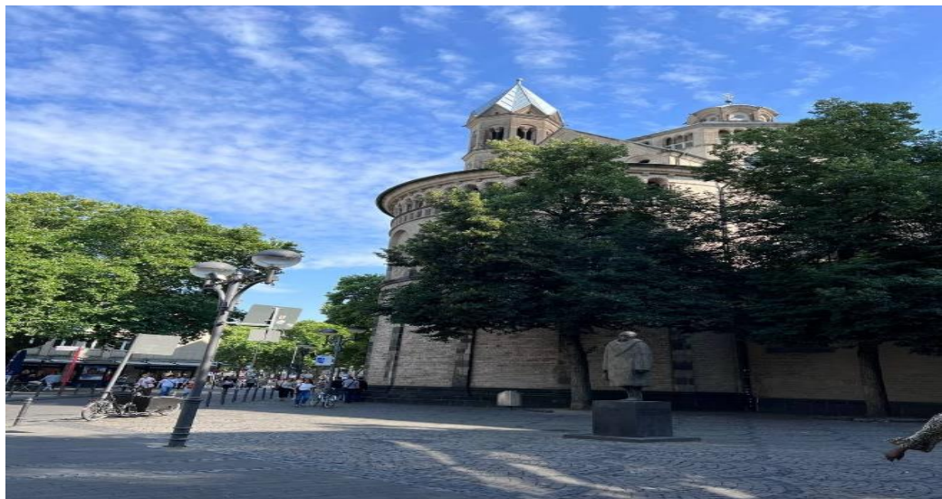
Рис.2.4. Церква Святих Апостолів

Церква Святих Апостолів в місті Кельн (Рис. 2.4), палац Бенрат, який знаходиться поблизу міста Дюссельдорф – архітектурний шедевр з елементами бароко та рококо, які точно мають оцінити прихильники цього стилю. Колишня вугільна шахта в місті Ессен, яка дуже давно виведена з експлуатації, і також належить до списку ЮНЕСКО та на сьогоднішній день є музеєм.