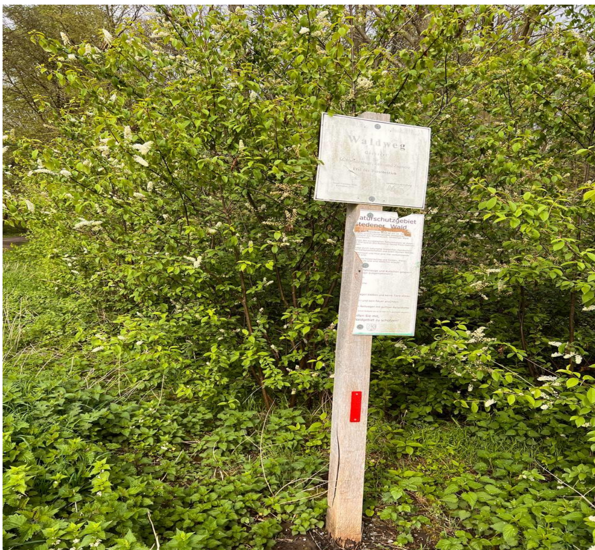
Заповідник Waldnaturschutzgebiet Knechtsteden