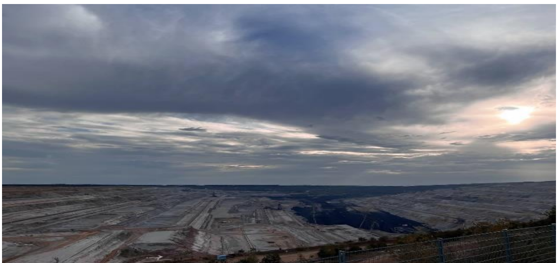
Рис. 2.2. Кар'єр в м.Ельсдорф

Кар'єр в м.Ельсдорф (Рис. 2.2.), який захоплює своїми масштабами, які можна споглядати з оглядового майданчика.