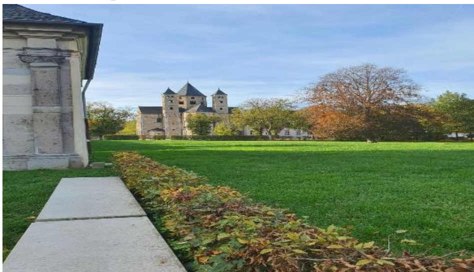
Рис. 2.11 Монастирський комплекс

Завершальним етапом мандрівки монастирський комплекс початку 12 століття який можна відвідати із середини, також та надбрамна будівля, яка зацікавляє своїм зовнішнім видом, виконаним в стилі схожому на барокко побудована в 1705 році. Від монастиря до воріт веде алея з лип. Також на цій же території розміщений гастротуристичний об'єкт, а саме місцевий ресторан під назвою «півний сад», який має позитивні відгуки від відвідувачів, та буде заключним етапом мандрівки заповідником (Рис.2.11).