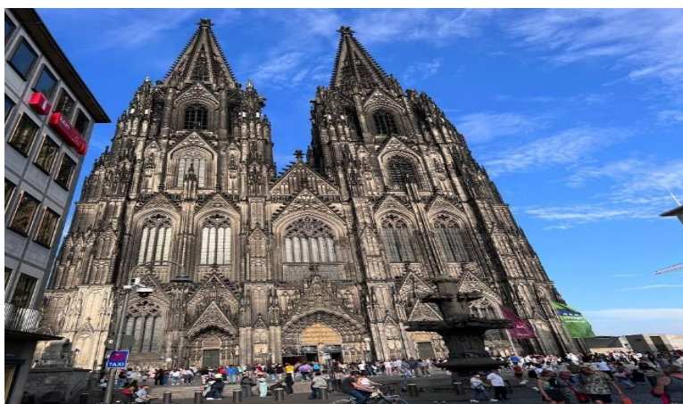
Рис. 2.3. Собор в м.Кельн

Серед культурних пам'яток хочу відзначити шедевр готичної архітектури Кельнський собор (Рис. 2.3.), який входить до списку світової спадщини ЮНЕСКО, та має цікаву історію із тривалістю в 600 років, та вражає своїми масштабами.