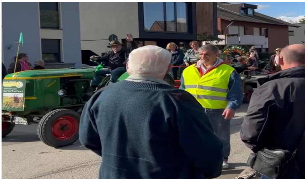
Рис. 2.6 Картофельфест

2. Картофельфест свято яке я раджу відвідувати саме в невеликих селах, задля отримання більших вражень від колориту. Свято проводиться в кінці осені, після закінчення збору урожаю картофеля, всі місцеві жителі збираються разом, фермери влаштовують парад із тракторів, потім всі куштують деруни, домашні кондитерські вироби, танцюють і слухають музику. (Рис. 2.6.)