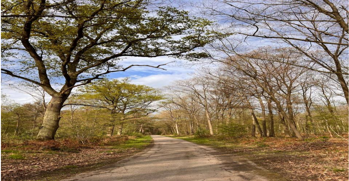
Рис. 2.10 «Танцюючі дерева»

Цікавою та інтригуючою пам'яткою є старовинні придорожні хрести, походження яких невідоме.