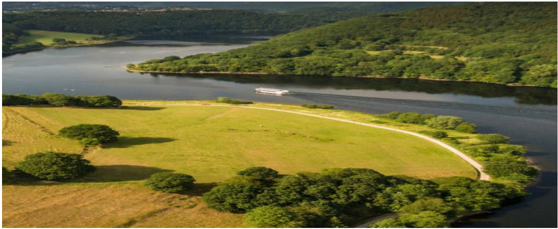
Рис. 2.1. Парк Ейфель

Також хочу підкреслити, що в парку є стежка, яка облаштована спеціально для людей із обмеженими можливостями, що є дуже великою перевагою. Тому парк підходить для груп людей різних категорій.