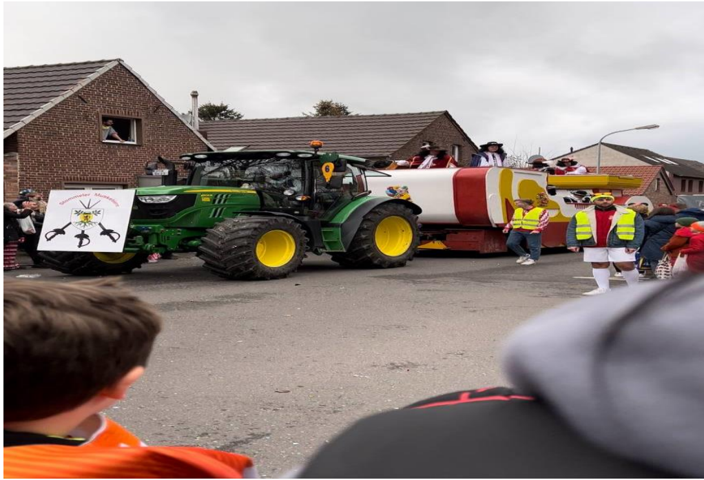
Рис. 2.5. Святкування карнавалу

Дуже цікава подія для спостереження, як люди перевдягаються в різних героїв, прикрашають трактори та автівки, та великою колією прямують по місту засипаючи все навкруг цукерками і різними дрібничками, під сміх і музику.