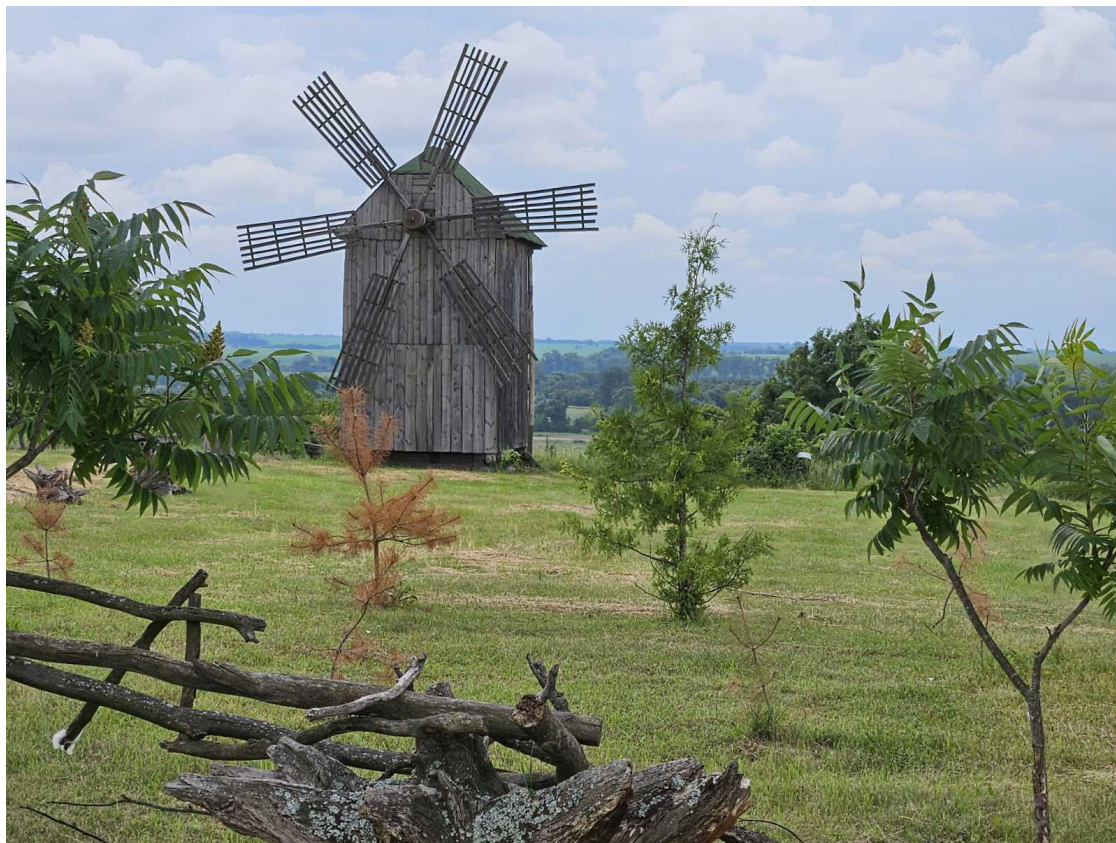
Рис. 2. Старовинний млин

Таким чином, іпотерапія - це комплексний метод реабілітації, який органічно поєднує фізичні, психологічні та соціальні аспекти відновлення людини.