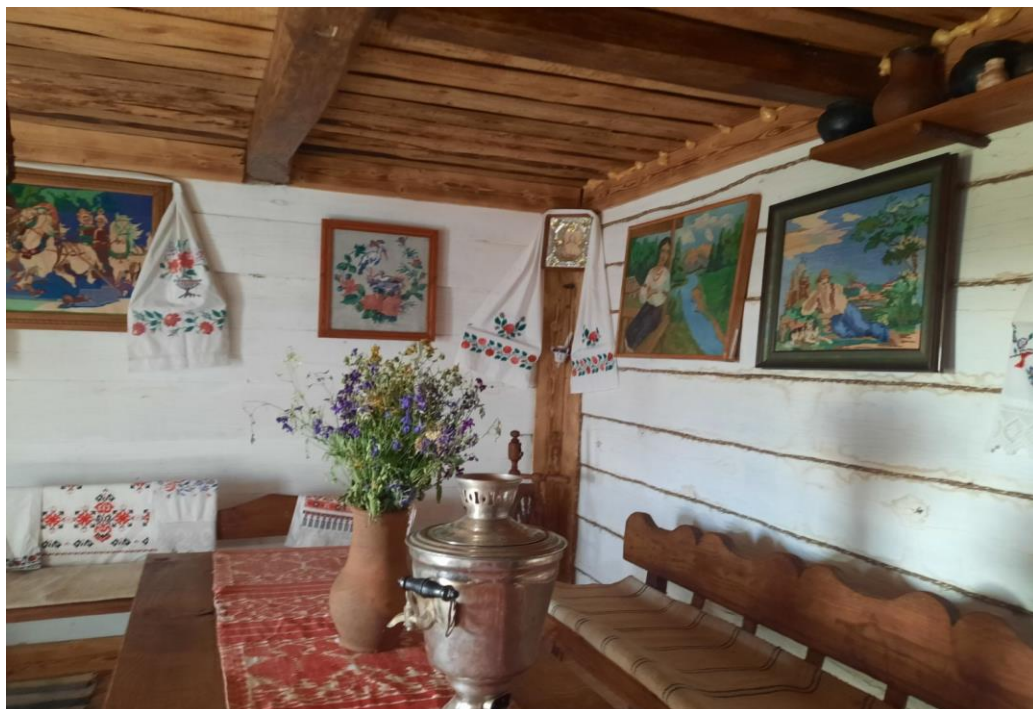
Рис. 4. Інтер'єр української хати