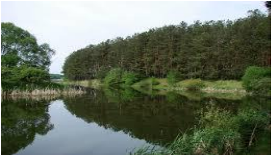
Рис. 6. Природа НПП «Деснянсько-Старогутський»

В північній частині Сумської області сільський та зелений туризм має усі можливі перспективи розвитку, якщо будуть враховані всі економічні, соціальні та етнокультурні аспекти.