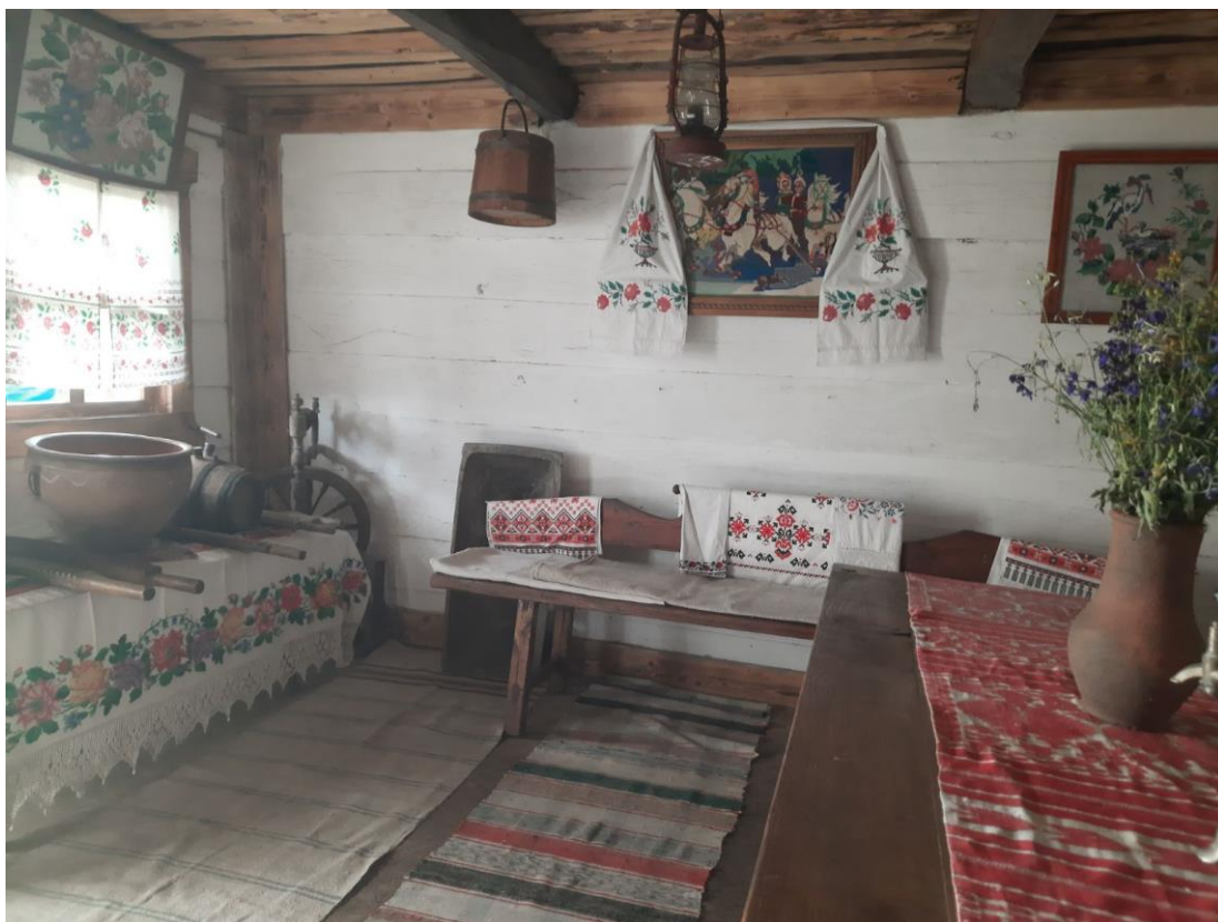
Рис. 3. Інтер'єр української хати