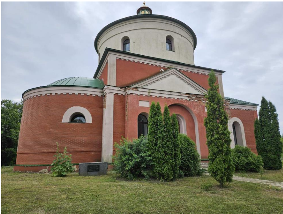
Рис. 1. Церква Успіння Богородиці

Садиба знаходиться на околиці села, поряд з церквою Успіння Богородиці (рис.1). Її загальна площа становить 2 га доглянутої та озелененої території. Тут розміщений старовинний млин середини 18 століття (рис. 2), стара українська хата, у якій повністю відображений побут українців (рис. 3,4), декілька альтанок для відпочинку та будиночок бджоляра.