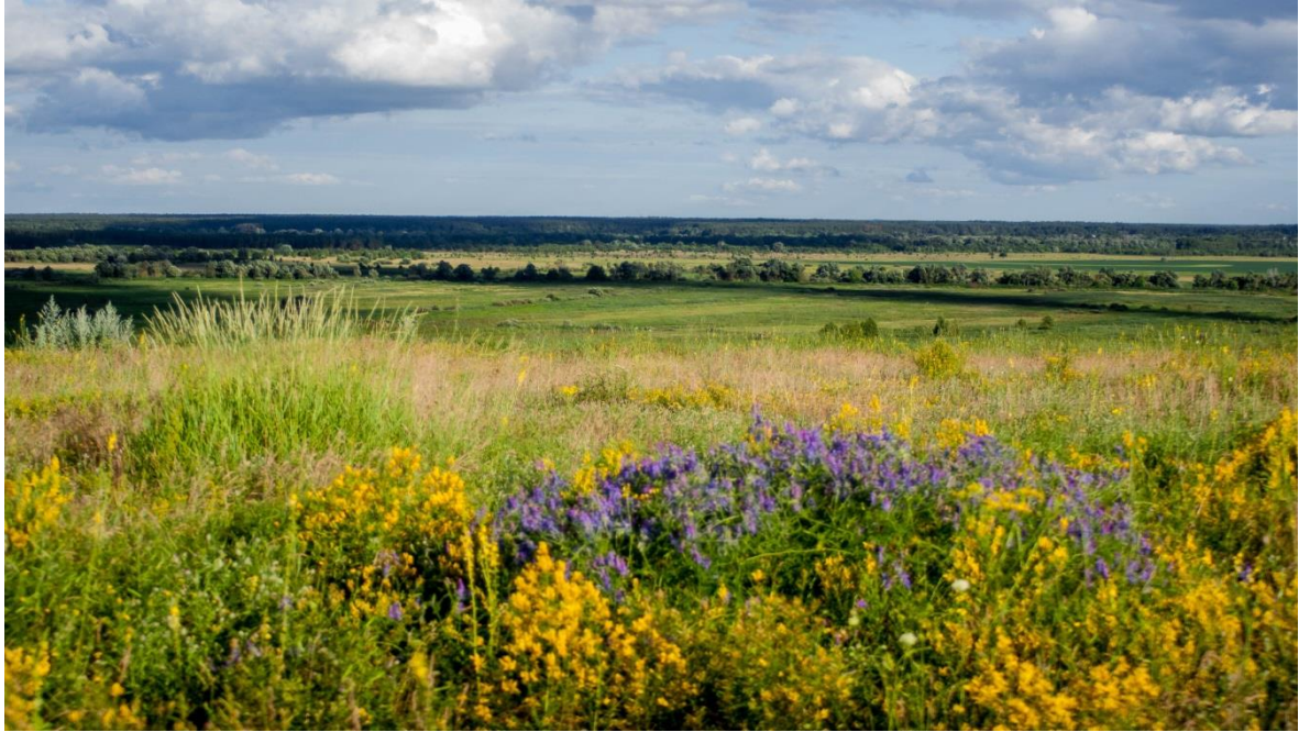
Рис. 5. Природа РЛП «Сеймського»

багатоденні «зелені» маршрути у поєднанні з сільським туризмом, що дасть можливість повноцінного відпочинку.