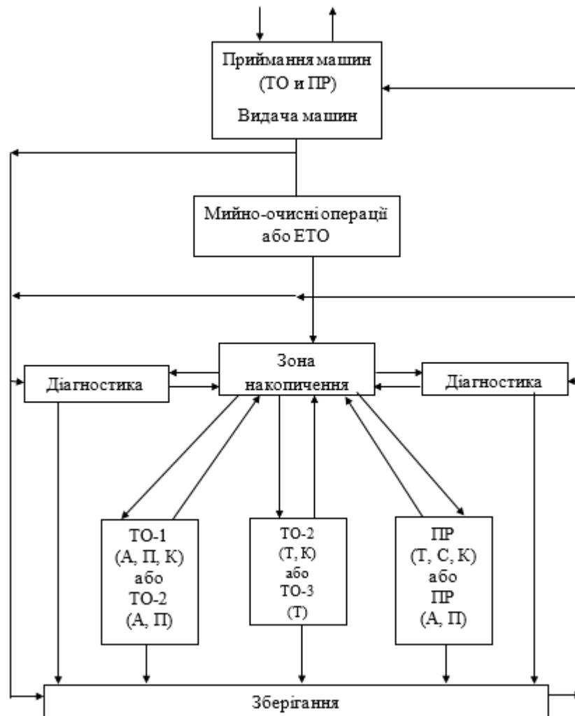
Рисунок 2.1 - Схема техпроцесу, який виконують у ремонтному підприємстві: Т - трактора(ТО - 2, ПР, ТО - 3); А - автомобілі (ТО - 2, ТО - 1, ПР); П - причеп (ТО - 2, ТО - 1, ПР); К - комбайн (ТО - 2, ТО - 2, ПР); С - сільгоспмашини (ПР); ЕТО – для щозмінного технічного обслуговування; ТО - 2, ТО - 3, ТО - 1 – номерні техобслуговування; ПР – для поточного ремонту.

Це дозволяє знизити ризик аварій, які можуть завдати шкоди водіям, пасажиром або стороннім особам. Крім того, систематичний догляд за технікою значно подовжує її строк служби, адже своєчасне виявлення та усунення проблем запобігає передчасному зношенню деталей і систем. Ще однією перевагою є зменшення витрат на ремонт і запасні частини: профілактичні заходи дозволяють уникати серйозних поломок, які потребують значних фінансових вкладень. Нарешті, технічне обслуговування сприяє екологічній