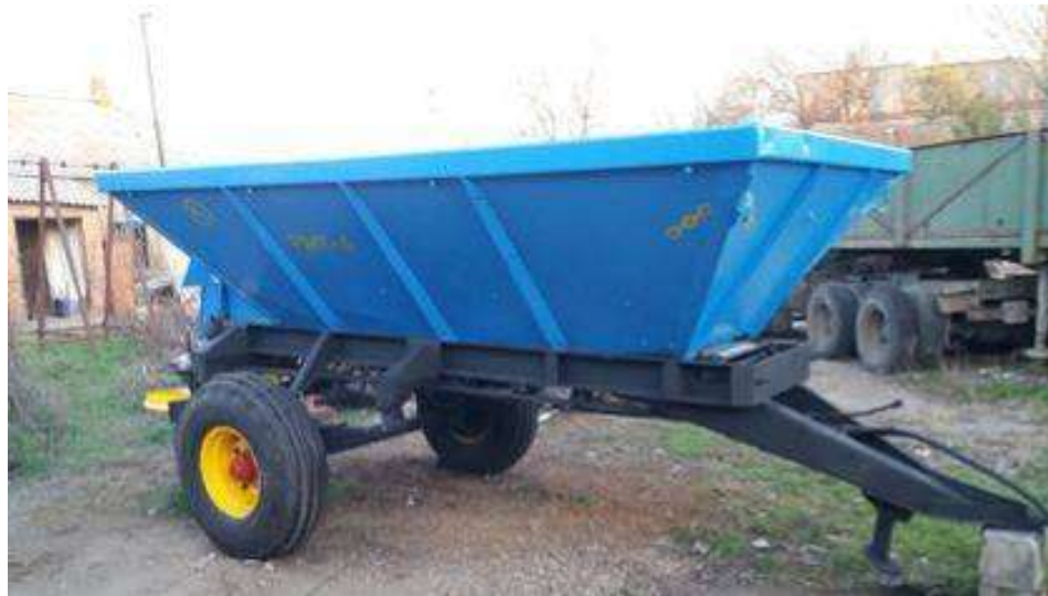
Рис. 2.8. Машина сільськогосподарського призначення для внесення добрив

Дана машина для розкидання мінеральних поживних речовин застосовується для розкидання по всій поверхні твердих мінеральних поживних сполук при переміщенні агрегату при операції по коліям (табл. 2.6).