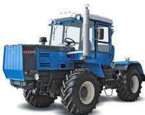
Рис. 2.7. Тягачі для здійснення операції внесення: ліворуч – МТЗ-1221, праворуч – ХТЗ-150К-09-25.