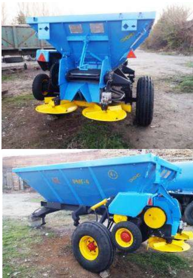
Рис. 3.1. Машина заводського виробництва для розкидання речовин підживлення.

машина) (рис. 3.1) та РМД-8 (2 машина). Якісна роботи цих машин забезпечує перекриття сусідніх рядочків. Модель машини та фракція мінеральних поживних речовин налаштовуються розміром перекриття проходів.