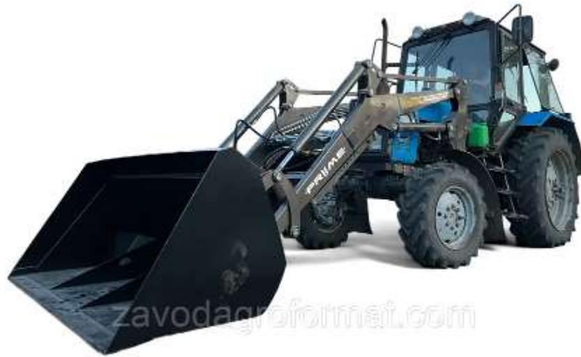
Рис. 3.3. Машина-вантажник КУН-4,2.

Змінюючи диски розсіювання різного розміру на краю подовжувача ми маємо можливість поліпшеною машиною для розкидання твердих поживних сполук контролювати розмір захвату на 1050 см, 1410 см та 1620 см.