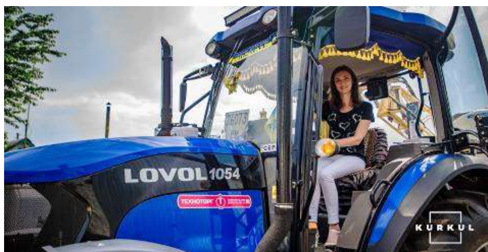
Рис. 1.1. Директор ФГ «ДІО» на тракторі LOVOL FT 1054

Таким чином, господарство в цілому забезпечене тракторами різного тягового класу і типу, але бажано мати в складі потужний енергетичний засіб потужністю 200-250 к.с.