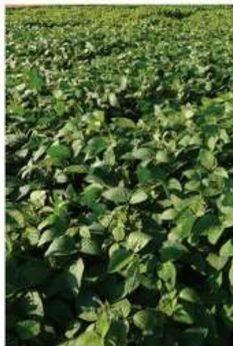
Рис. 2.4. Об'єми підживлення бобів сої.