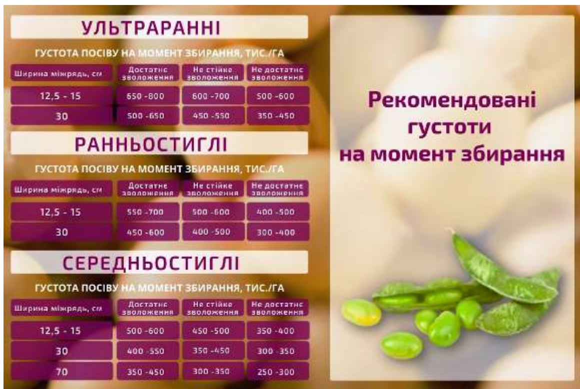
Рис. 2.6. Кількість рослин для різних сортів стиглості.