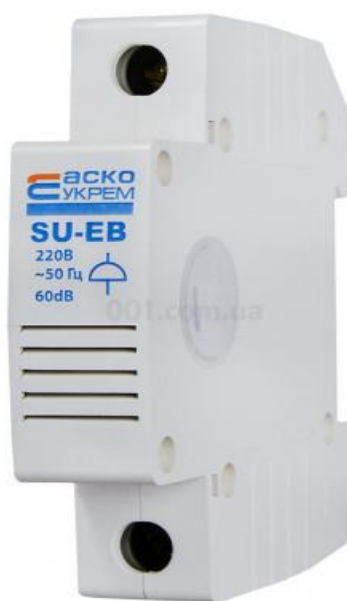
Рисунок 9. Дзвінок на DIN-рейку SU-EB 220В, АСКО-УКРЕМ

Для інформування персоналу при роботі з мийкою високого тиску вважається необхідним використання дзвоника. З цією метою, пропонується використовувати дзвоник SU-EB 220В компанії АСКО-УКРЕМ, який монтується на DIN-рейку. Зображення такого дзвоника показано нижче, на рисунку 9.