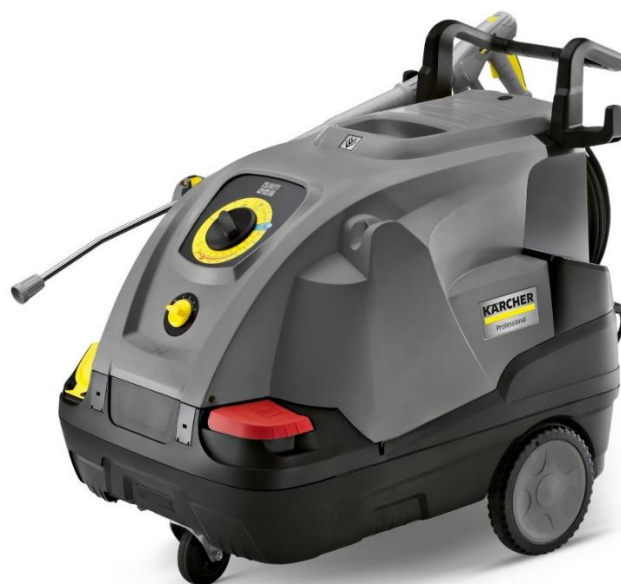
Рисунок 5. Мийка високого тиску KARCHER PROFESIONAL

Серед додаткових засобів та пристроїв доцільним є підключення в систему: