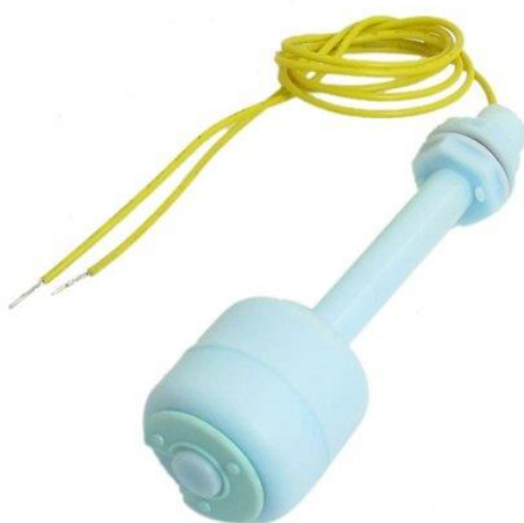
Рисунок 11. Датчик рівня рідини