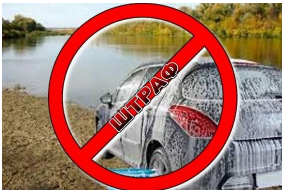
Рисунок 13. За забруднення навколишнього середовища мийкою транспортних засобів накладається штраф

Опис процесу: дана система автоматизації включає в себе встановлення резервуару та фільтру для очищення та повторного використання відпрацьованої води, та економії більше 3000 кубічних метрів прісної придатної для використання води. Також дане удосконалення допоможе значно зменшити потрапляння шкідливих речовин до навколишнього середовища.