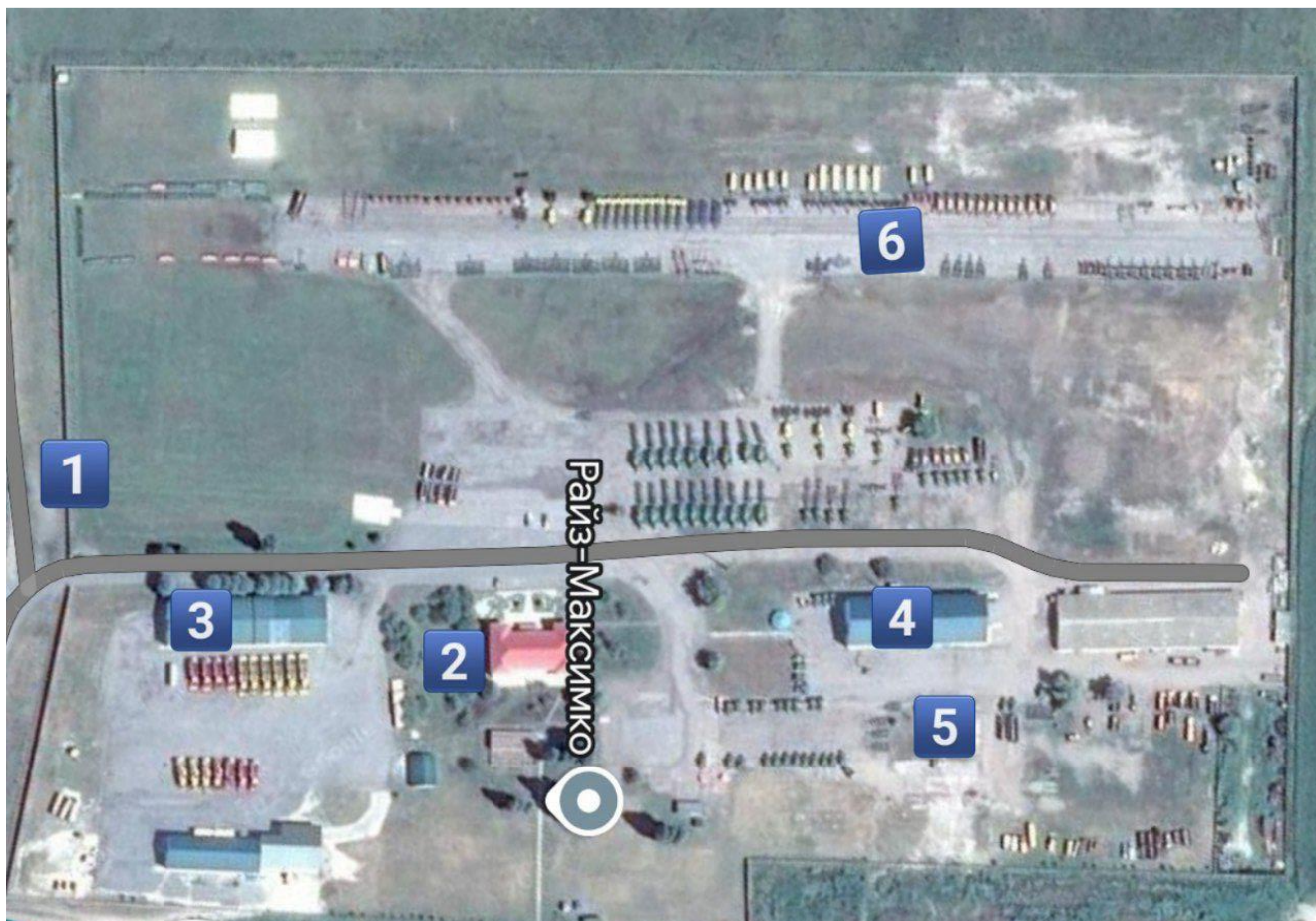
Рисунок 1. структура найбільшої бази ТОВ «Райз-схід». 1-контрольно-пропускний пункт, 2-головний офіс, 3-реактор, 4-пункт технічного обслуговування техніки, 5-мійка високого тиску, 6-місце стоянки агрегатів

Автомобілі: ВАЗ 21213, 21214, Renault Dokker, Duster, Hyundai Tucson, Н350, які використовуються агрономами, агротехніками та сервісними інженерами.