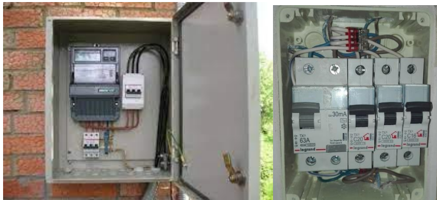
Рисунок 4. Ввідний електричний щит, захисний автоматичний вимикач

Також, в щиту електричному присутній лічильник електричної енергії, яким здійснюється облік електричної енергії саме по групі споживачів освітлення.