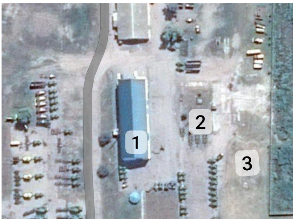
Рисунок 7. Розташування мийки транспортних засобів на території ТОВ «Райз-схід». 1 – пункт технічного обслуговування техніки; 2 – приміщення та майданчик мийки високого тиску; 3 – водонапірна вежа.

Приміщення де встановлені мийки високого тиску знаходиться поряд із ангаром пункту технічного обслуговування техніки на території господарства. Мийка встановлена між пунктом технічного обслуговування та водонапірною вежею для зручності використання.