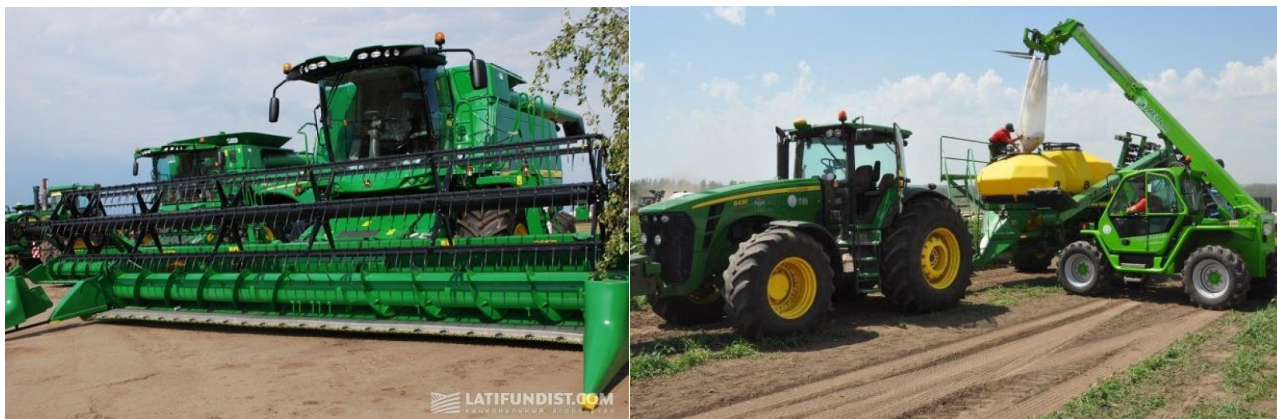
Рисунок 8. Техніка яка використовується товариством Райз-схід

зерно та кормозбиральні комбайни John Deere, причіпні та навісні агрегати до техніки, автомобілі ВАЗ, МАЗ, Renault, Hyundai.