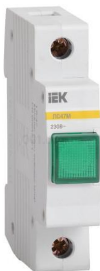
Рисунок 10. Сигнальна лампа LC-47M на DIN-рейку

Наступним з елементом сигналізації обираємо світлосигнальну апаратуру. Для зручності користування, доцільним буде підключення усіх сигнальних ламп виконаних з розрахунком для монтажу на DIN-рейку.