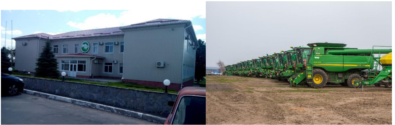
Рисунок 2. Головний офіс та техніка ТОВ « Райз-схід»