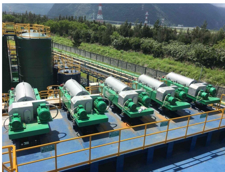
Рисунок 1.2 – Центрифуги для очищенні стічних вод

Центрифуги відіграють життєво важливу роль у сучасному очищенні стічних вод (рис. 1.2). Ці машини використовують обертову силу для відділення твердих речовин від рідин, що робить їх ключовим інструментом в очищенні води. Центрифуги можуть видаляти до 99% твердих частинок зі стічних вод, значно покращуючи їх якість.