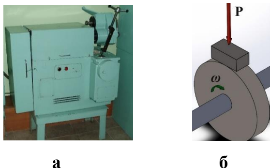
Рисунок 2.4 – а – установка для іспитів на тертя «СМЦ-2»; б – схема іспитів «диск-плоский зразок»

Порівняльні дослідження проводили на машині тертя «СМЦ-2», за схемою «диск-плоский зразок». В якості плоского зразка використовували зразок з твердого сплаву ВК6, розміром: 10x20x8 мм (рис. 2.4).