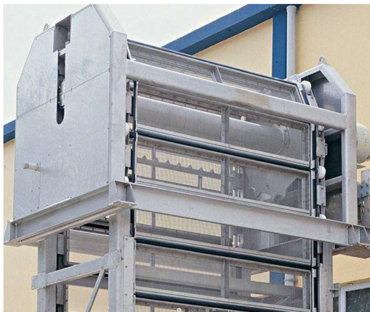
Рисунок 1.3 – Фотографія стрічкових решіток для очищення стічних вод

Стрічкові решітки (рис.1.3) необхідні для видалення сміття зі стічних вод та захисту процесів, що йдуть далі. Їхня конструкція забезпечує високу ефективність фільтрації твердих частинок, підвищуючи загальну ефективність очищення. Стрічкові фільтри адаптовані до суворих екологічних стандартів, зменшуючи екологічний слід скидання стічних вод.