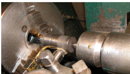
Рисунок 2.1 – Використання БУФО для обробки зраза типу тіла обертання

Використання БУФО для обробки зразків типу тіл обертання проводять на токарних верстатах.