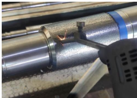
Рисунок 2.1 – Фотографії ЕІЛ підшипникової шийки валу

Недоліками методу ЕІЛ є підвищення шорсткості, нанесеного шару, появи розтягуючих залишкових напружень і зниження втомлюваності міцності.