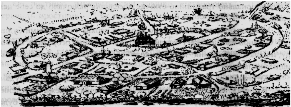
Рис. 1. Схема планування узагальненого традиційно-етнічного (сільського) поселення

Постановка проблеми в загальному вигляді. Для об'єктивного дослідження сучасних просторів великих міст-мегаполісів автору статті необхідно було віднайти (як модель-еталон) полярно-протилежні (міським) простори. Для такої моделі була розроблена схема узагальненого традиційно-етнічного (сільського) поселення (Рис. 1). Основою моделі слугувала сучасна забудова сіл Слобожанщини (Харківська і частина Сумської областей) та простори музею народної архітектури та побуту України поблизу с. Пирогове Київської області. Але цього мало. Для постійного порівняння узагальненого (умовного) простору поселення з просторами мегаполісу, необхідно виконати низку досліджень просторів узагальненого традиційно-етнічного поселення.