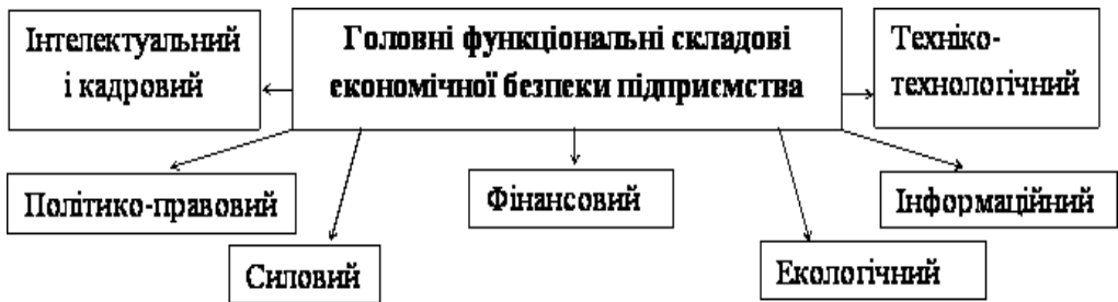
Рис. 1 Функціональні складові економічної безпеки підприємства

Фінансова складова є однією з провідних і вирішальних. Суть її полягає в досягненні найбільш ефективного використання корпоративних ресурсів підприємства.