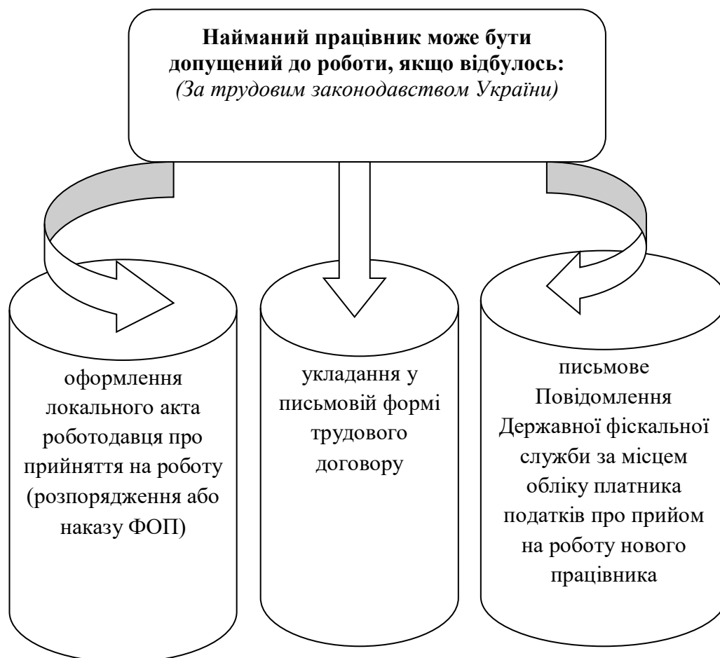
Рис. 1. Основні три події, при яких відбуваються неприховані трудові відносини

Таким чином, відповідно до трудового законодавства України найманий працівник може бути допущений до роботи, якщо мали місце три основні події, що зображені на рис. 1.