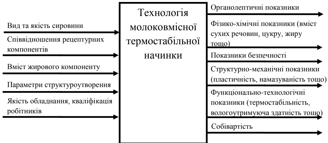
Рис. 1. Параметрична модель «чорний ящик» технології молокової термостабільної начинки.

В даній моделі при приготуванні молокової термостабільної начинки входами є вид та якість сировини, співвідношення рецептурних компонентів, вміст жирового компоненту, параметри структуроутворення, якість обладнання, кваліфікація робітників.