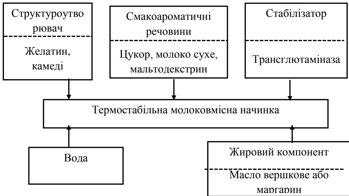
Рис. 2. Модель «склад системи» молокової термостабільної начинки

Враховуючи знання щодо властивостей сировини, глибини вивчення досліджуваної проблеми та проведення огляду літератури нами була побудована модель «склад системи» молокової термостабільної начинки, яка наведена на рис. 2.