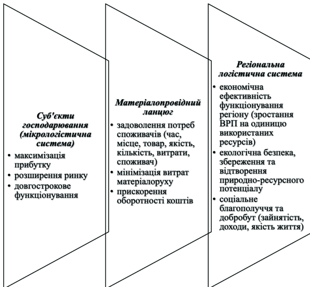
Рис. 2. Ієрархія цілей в рамках регіональної логістичної системи авторська розробка

можна трактувати як діяльність із планування, організації, мотивації, контролю діяльності економічних агентів, що виходить із розуміння змісту їх взаємовідносин та інтеграційних відносин, який полягає в участі у процесах формування / трансформації / руху різних потоків, сформованих з використанням та залученням регіональних ресурсів. Це є засобом досягнення цілей інтегрованого управління сталим розвитком на регіональному, міжрегіональному та національному рівні, за умови розробки відповідної формалізованої моделі РЛС з відображенням усього комплексу соціо-еколого-економічних зв'язків, що може становити предмет подальших досліджень у цій сфері.