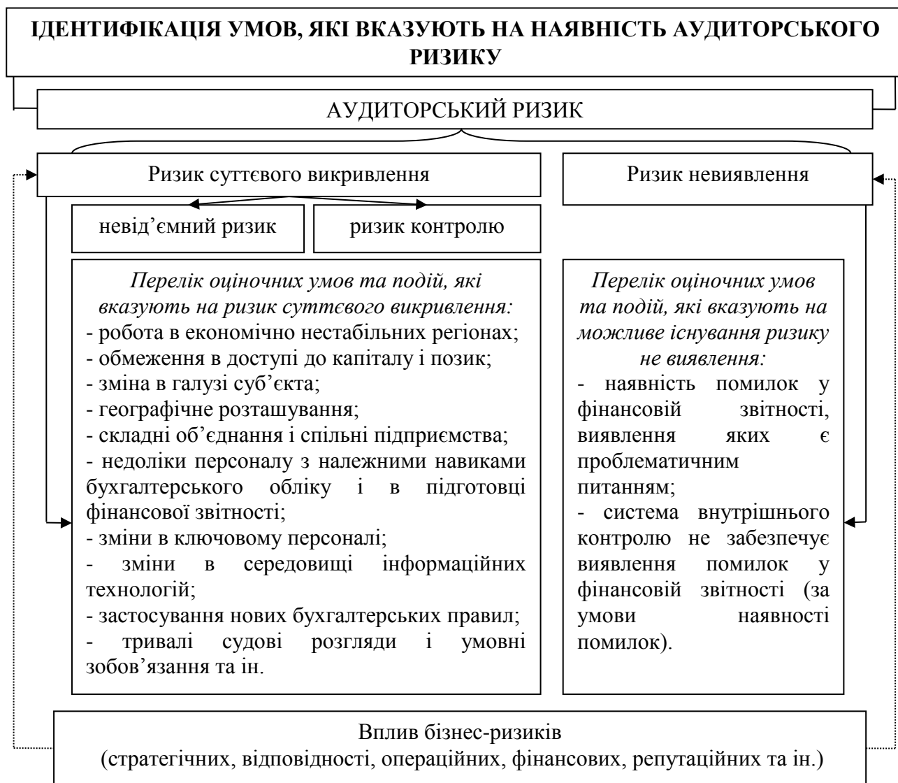
Рис. 2. Ідентифікація умов, які вказують на наявність аудиторського ризику

Оцінка аудиторського ризику не є питанням, що піддається точному оцінюванню. Це – питання професійного судження аудитора. Водночас потрібно враховувати, що аудиторський ризик є технічним терміном, який пов'язаний із процесом аудиту [3]. На рис. 2 ідентифіковано умови, які можуть вказувати на наявність аудиторського ризику.