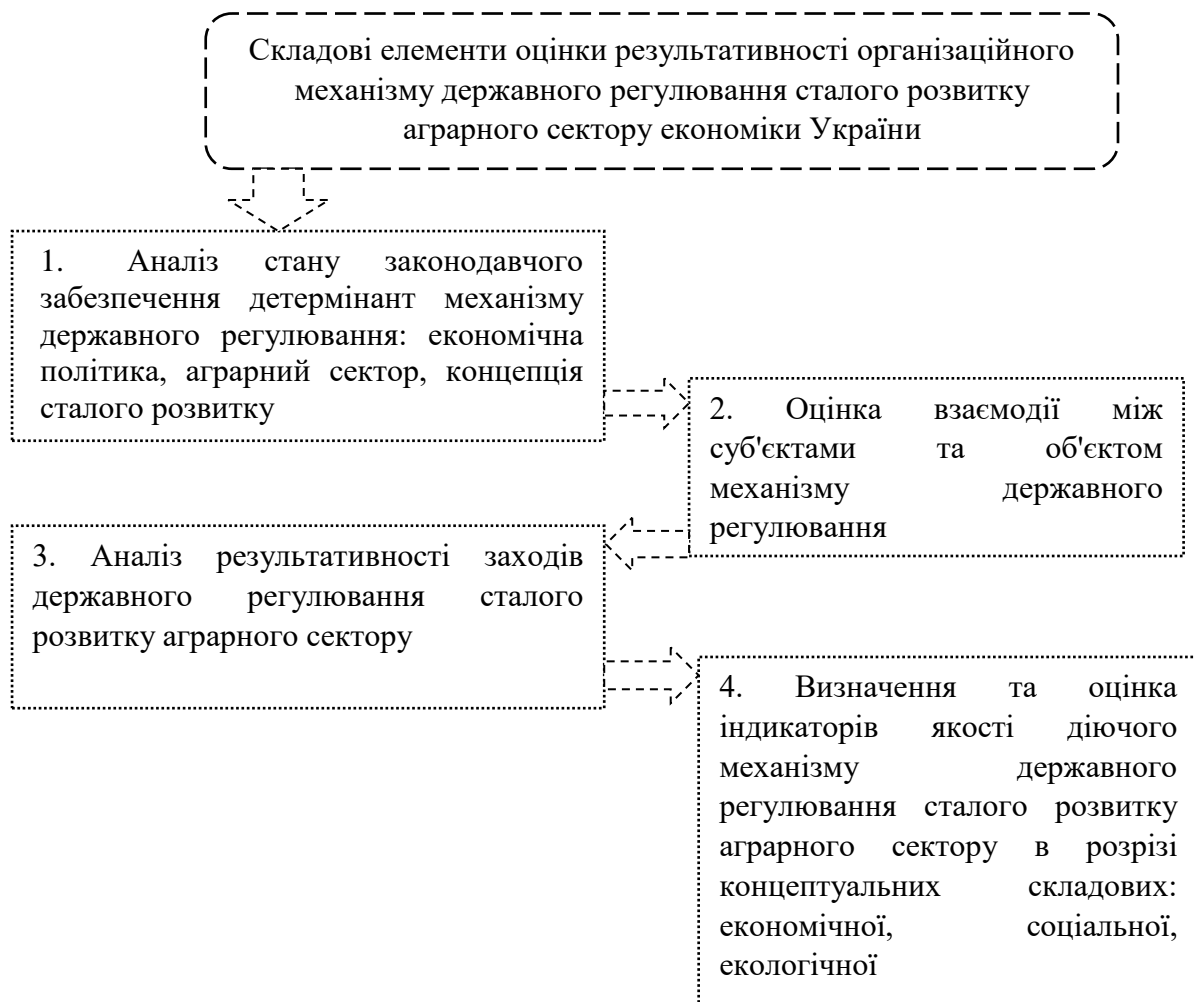
Рис. 2. Схема проведення оцінки результативності організаційного механізму державного регулювання сталого розвитку аграрного сектору економіки України

Представлений на рисунку 1 організаційний механізм характеризується наявністю структури, комплексу взаємопов'язаних та взаємозалежних елементів, переліку завдань, практична реалізація яких, забезпечить досягнення загальної цілі. Враховуючи багатовекторність та комплексність елементів організаційного механізму державного регулювання сталого розвитку аграрного сектору економіки України та його цільову спрямованість, обґрунтовано етапи та складові елементи проведення оцінки його результативності, котрі представлено на рис. 2.